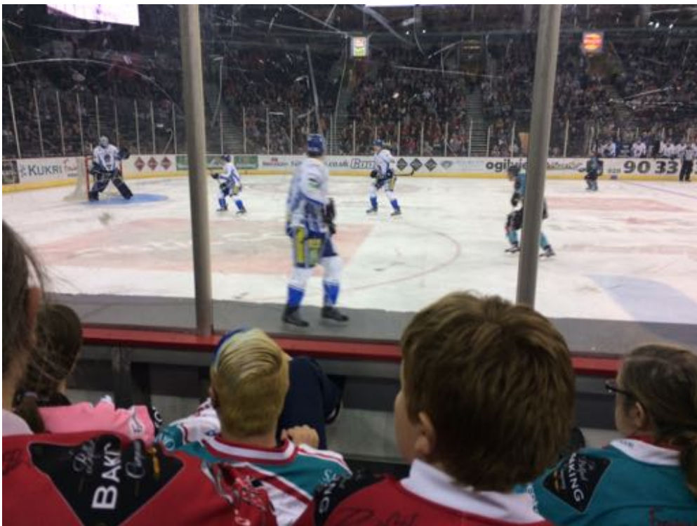
Ice Hockey Spiel der Belfast Giants