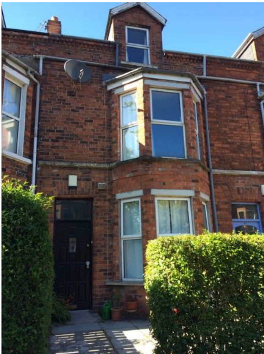
Unser Haus im Süden Belfasts

Von Dublin aus nahm ich den Bus nach Belfast, meiner neuen Heimat, die mich im Gegensatz zu Dublin nicht mit Regen, sondern mit strahlendem Sonnenschein empfing. Um vom City Centre zu unserer WG im Süden Belfasts zu gelangen, nahm ich Platz in einem, für Belfast typischen, pinken Doppeldeckerbus. In der WG angekommen, richtete ich mein Zimmer ein und nach und nach kamen auch meine vier anderen Mitbewohner (wir sind alle EIRENE-Freiwillige in Belfast) von ihrer Arbeit nach Hause – unsere WG war mit meiner Ankunft komplett.