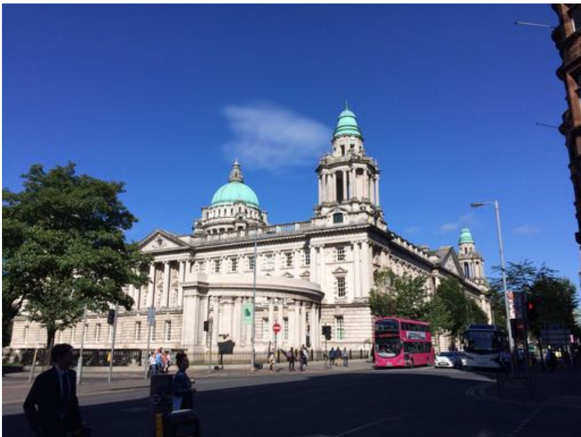
Belfast City Hall

Obwohl Belfast auf den ersten Blick nicht die schönste Stadt ist, bin ich dankbar hier ein Jahr lang leben zu dürfen.