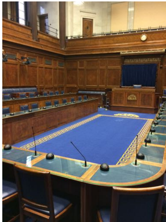
Ausflug mit der Männergruppe nach Stormont, Sitz des nordirischen Parlaments

Meine Aufgabe ist die Mithilfe beim Kochen des Mittagessens für die Gruppen sowie die Mithilfe bei der Programmplanung. Nach dem gemeinsamen Mittagessen findet meist ein Workshop statt, so haben beispielsweise schon eine Polizistin und eine Bibliothekarin interessante Vorträge für die Gruppen gehalten. Die Männer spielen außerdem sehr oft Billard, wohingegen die Frauen sehr gerne basteln, nähen und häkeln. Die Gruppen machen auch des Öfteren Daytrips, beispielsweise nach Stormont, Larne oder ins Ulster Folk and Transport Museum, bei denen ich die Gruppen begleite.