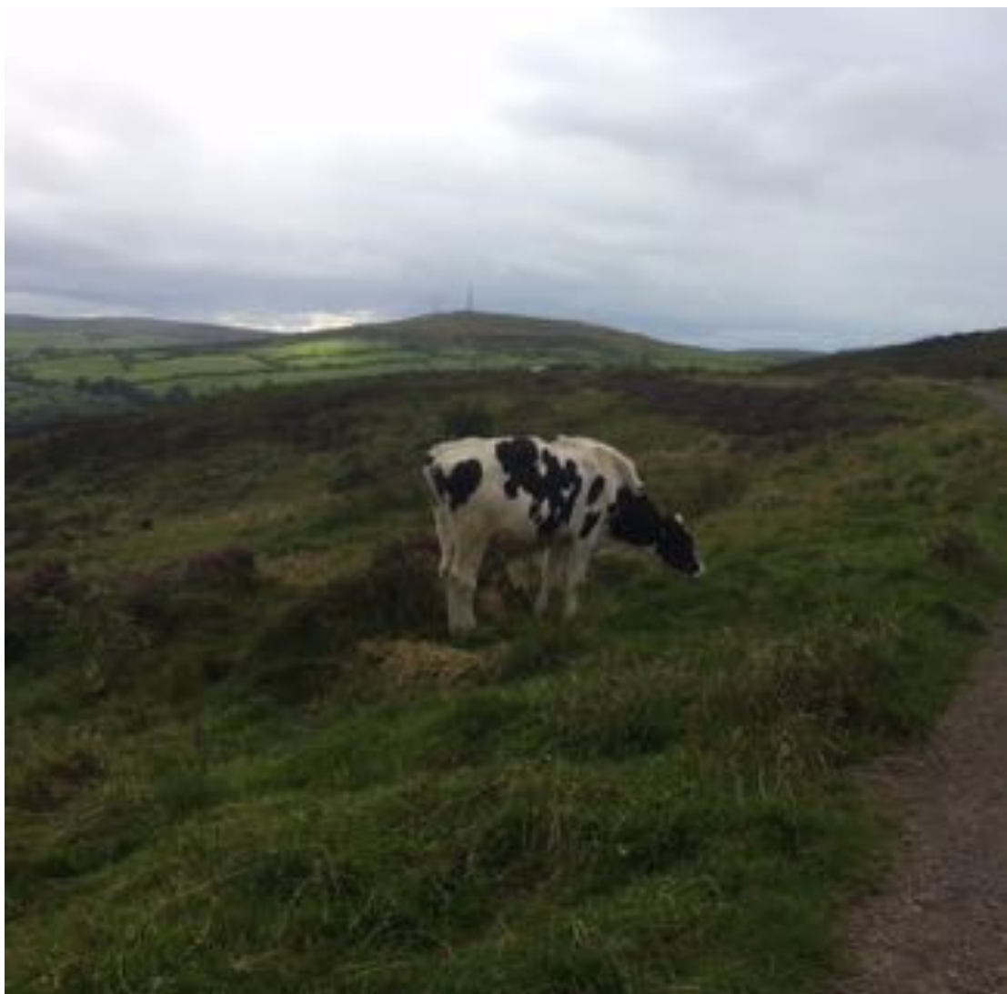
Wunderschöne Landschaft auf dem Cave Hill

Meine freie Zeit nutze ich gemeinsam mit meinen Mitfreiwilligen, um neben Belfast auch die restliche grüne Insel besser kennenzulernen. So haben wir beispielsweise den Cave Hill erklimmt, einen doppelten Regenbogen auf dem Black Mountain bestaunt, sind an den wunderschönen Strände in Newcastle und Portrush entlang gelaufen und waren bei der größten Halloween-Parade Europas in Derry/Londonderry.