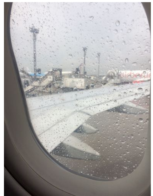
Regen in Frankfurt

Am 04. August 2016 machte ich mich schwer gepackt auf den Weg Richtung Frankfurt Flughafen, mein Abenteuer "Freiwilligendienst in Belfast" begann. Die Vorbereitung auf diesen Dienst, vor allem die mentale, hatte eigentlich schon mit dem Informationstag im Oktober, dem Bewerberauswahlverfahren im Dezember, dem Schalomtag im Februar, der Projektreise im Mai sowie dem Ausreisekurs im Juli begonnen. Realisieren konnte ich die Tatsache, dass ich ein Jahr in einem anderen Land leben werde, allerdings erst, als ich mich von meinen Freunden und von meiner Familie verabschiedet hatte und ich alleine im Flugzeug nach Dublin saß. Nachdem sich Deutschland von mir mit einem kräftigen Regenschauer verabschiedet hatte, begrüßte mich die grüne Insel, wie sollte es anders sein, mit Regen.