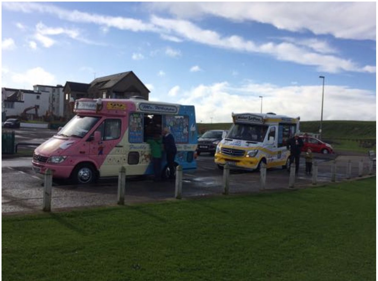
Ice Cream Vans in Portrush