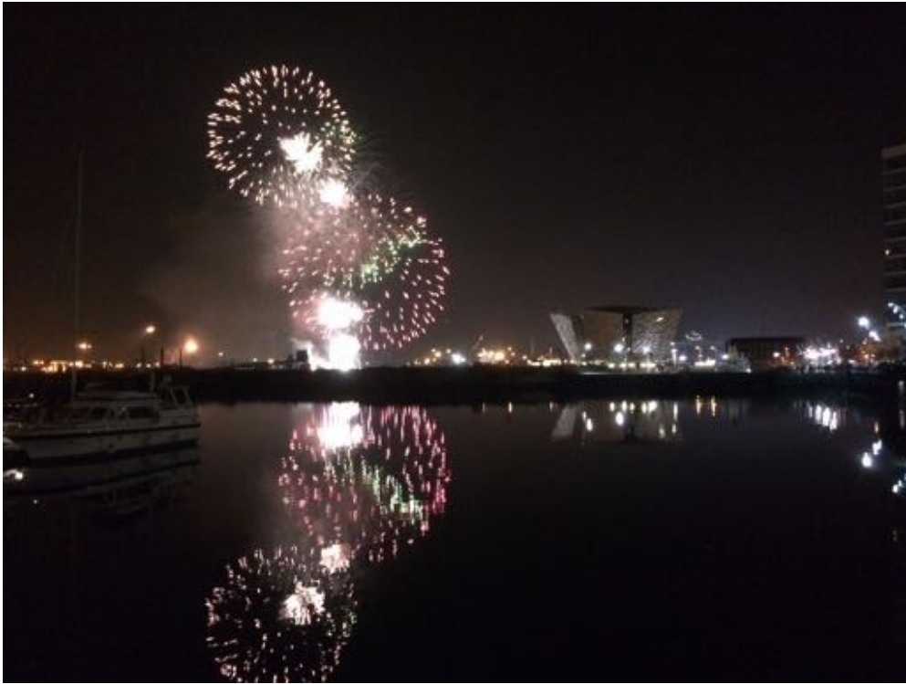
Feuerwerk an Halloween im Titanic Quarter