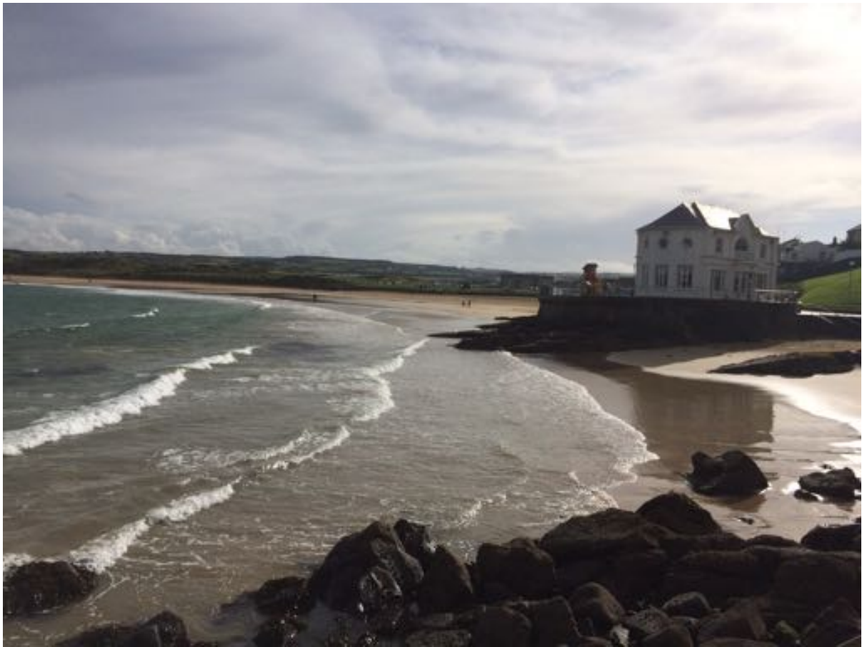
Strand in Portrush