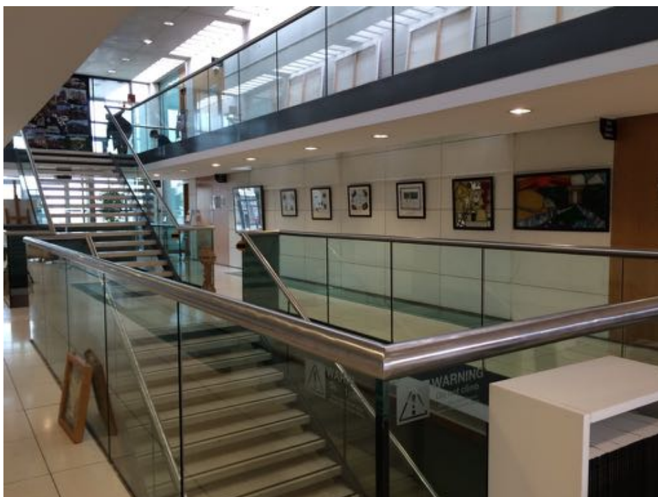
Der Aufbau der Kunstausstellung "The Journey" in Armagh

Zusätzlich veranstalten die verschiedenen Centre immer wieder Events, die eine willkommene Abwechslung in meinem Freiwilligendienst sind. So war ich beispielsweise bei einer Kunstausstellung aller WAVE Centre in Armagh. Jedes ausgestellte Kunstwerk war im Prozess der Verarbeitung eines individuellen Traumas entstanden und erzählte eine eigene Geschichte, was unglaublich spannend und eindrucksvoll war.