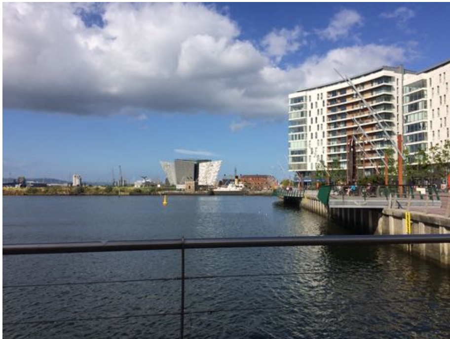
Blick auf das Titanic Museum im mordenen Titanic Quarter

Einerseits ist man in Belfast täglich mit der Geschichte Nordirlands konfrontiert, beispielsweise durch die Murals, Flaggen und natürlich die Peace Walls, andererseits merkt man bei Veranstaltungen wie der Culture Night, der Open Gallery Night oder auch auf den Konzerten, die wir bisher besucht haben, wie sehr Belfast sich bereits verändert hat und auch zukünftig weiter verändern wird.