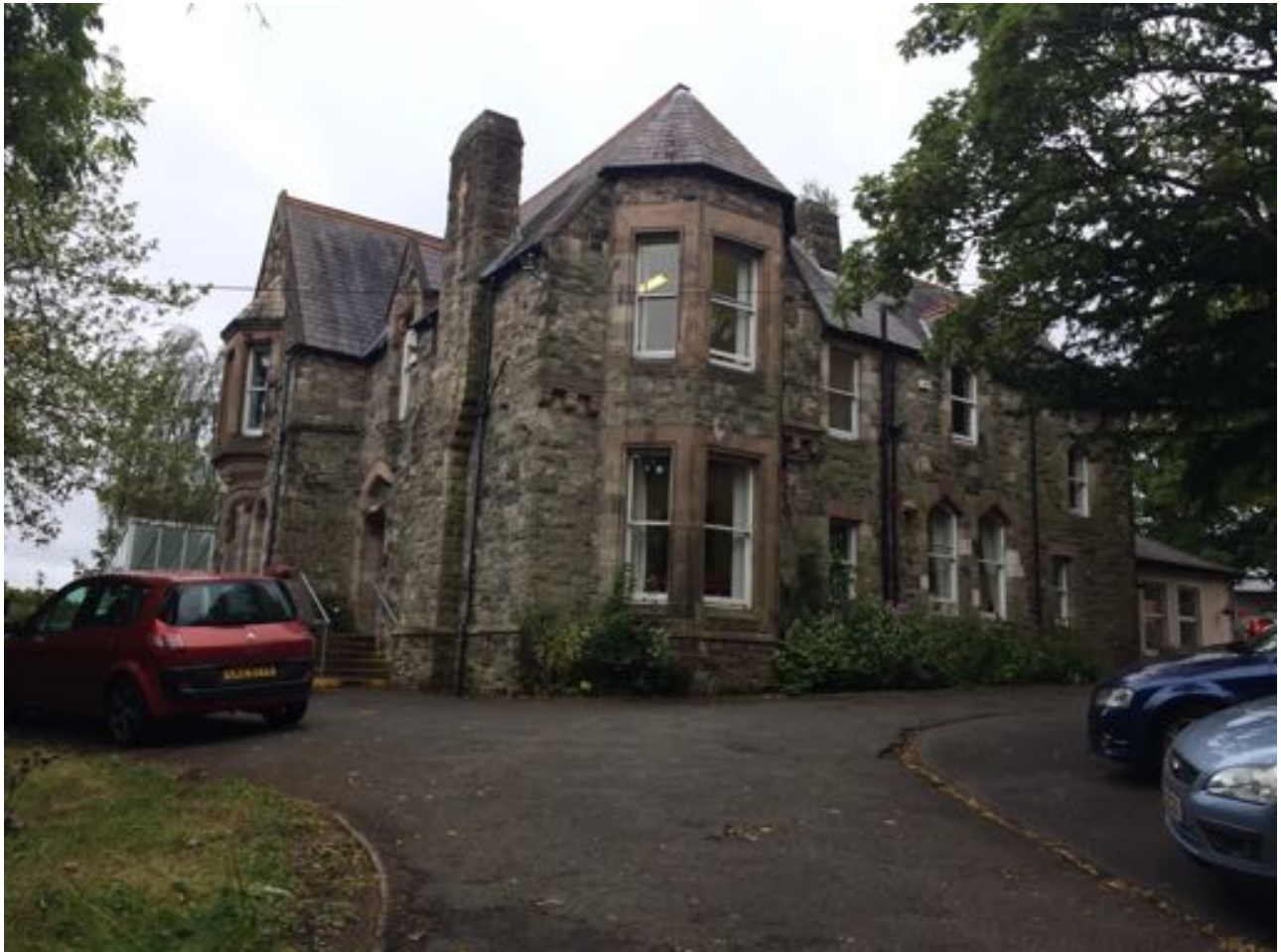
Meine Einsatzstelle, das WAVE Trauma Centre im Norden Belfasts

Witwen und Witwer, die ihre Männer/Frauen aufgrund der Troubles verloren haben, zu unterstützen. Seit der Gründung ist WAVE sehr stark gewachsen. Zur Zeit gibt es in Nordirland insgesamt fünf WAVE Centre (Belfast, Omagh, Armagh, Ballymoney, Derry/Londonderry), wobei Belfast das größte Centre ist.