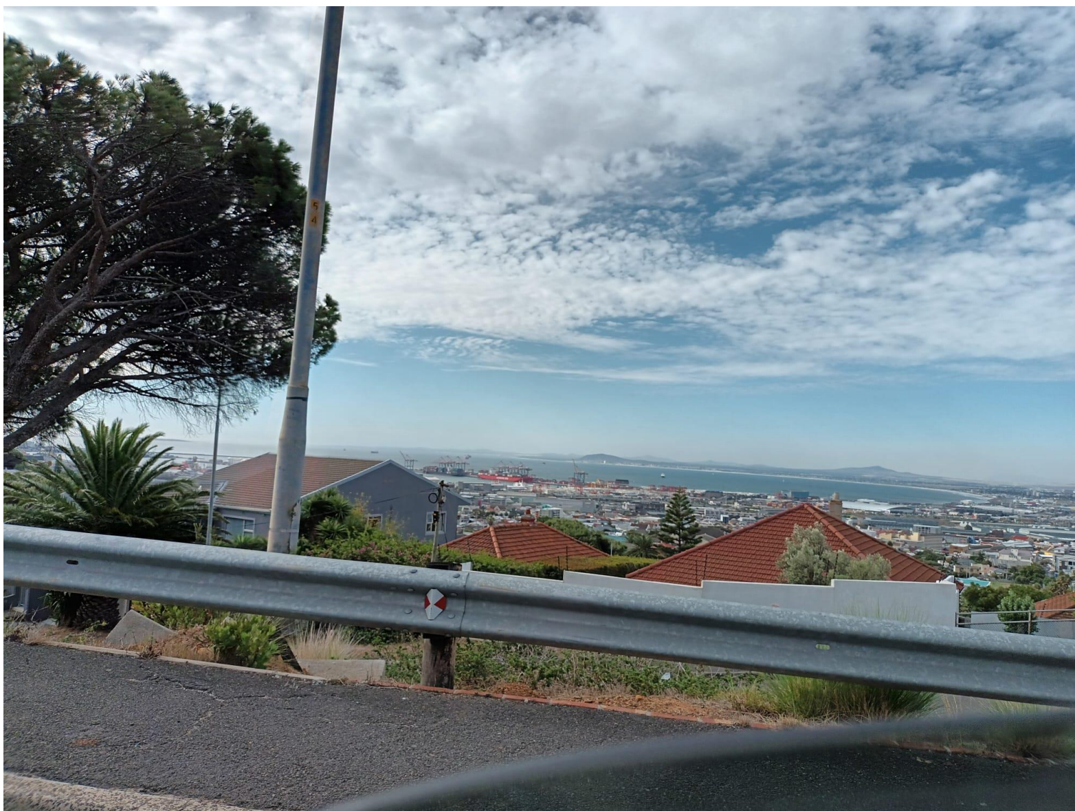
Die Sicht auf Woodstock vom Highway