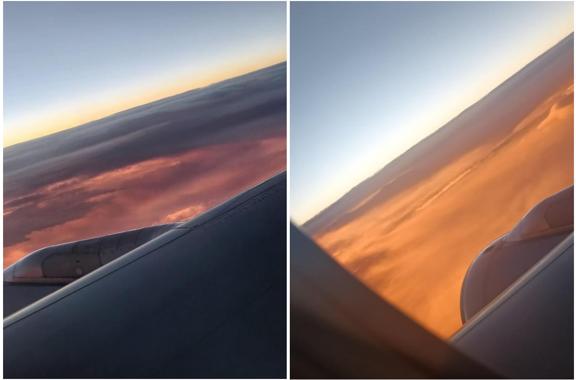
Die Sicht aus dem Flugzeug nach Kapstadt.

Am Sonntag ging es dann weiter nach Kapstadt.