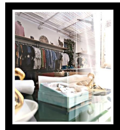
Eins meiner Lieblings Bilder die ich für einen Post benutzt habe. Es ist ein Bild aus unsere Secondhandshop.

Einer meiner Haupttätigkeiten in NOAH ist es, mich um die Social Medias zu kümmern. Dazu gehört NOAHS Facebookseite und der Instagram Account. Für beide kriege ich die Posts und schieße die Fotos, Jane hilft mir dann die Posts zu bearbeiten, damit die Texte grammatikalisch oder mehr in der Sprache angepasst sind. Dabei lerne ich viel über die allgemeine englische Sprache, als auch über das südafrikanische Englisch. Das macht eine Menge Spaß, da ich meine Neugierde freien Lauf lassen kann und mich über alles rund um NOAH informieren kann. Wenn bestimmte Aktionen gestartet werden, wie zum Beispiel die Geburtstagsfeier für alle Mai Kinder, bin ich natürlich dabei, um das perfekte Bild zu schießen. Fast wie ein Reporter, nur nicht so formell.