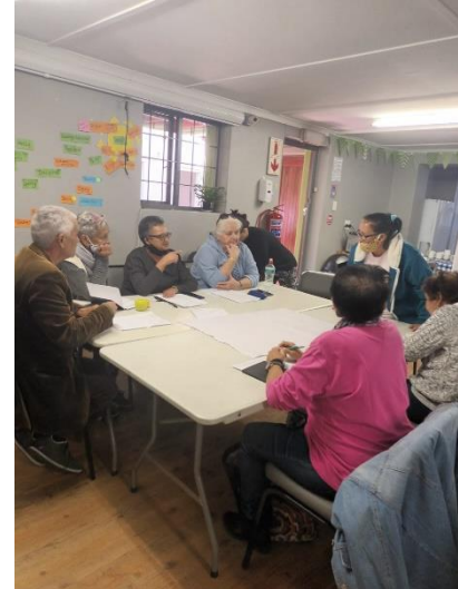
ABCD (Asset-based community development) Workshop für Business und Marketing.

NOAHS Ziel ist es, den Vorurteilen voraus zu sein. Nur weil du älter bist, heißt es nicht, dass du nichts bewirken kannst. Egal wie groß oder klein es ist, jede Idee und jeder Umschwung der gebracht wird, lässt die Gemeinschaft vorantreiben.