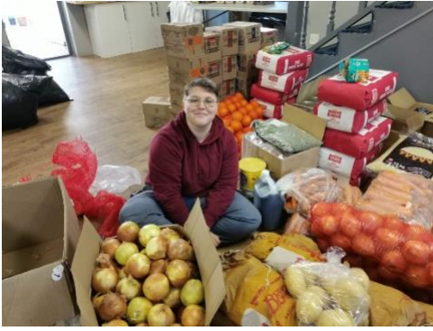
Sortieren geht über Studieren.