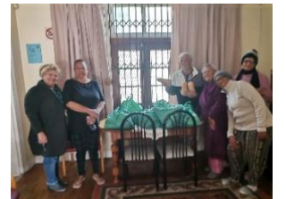
Eine große Spende von einem Unternehmen.