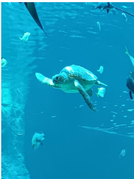
Ein hallo von Siggie der Schildkröte, die die NOAH Mitglieder aus Khayelitsha und ich auf einem Ausflug getroffen habne.

Für die Posts hingegen ist es meistens ein wenig schlichter. Denn gedacht ist es eigentlich eher, das der Moment eingefangen wird und nicht konstruiert wird. Weswegen ich Canva meistens nur benutze, wenn wir mal kein passendes Bild haben oder ich etwas ausprobieren.