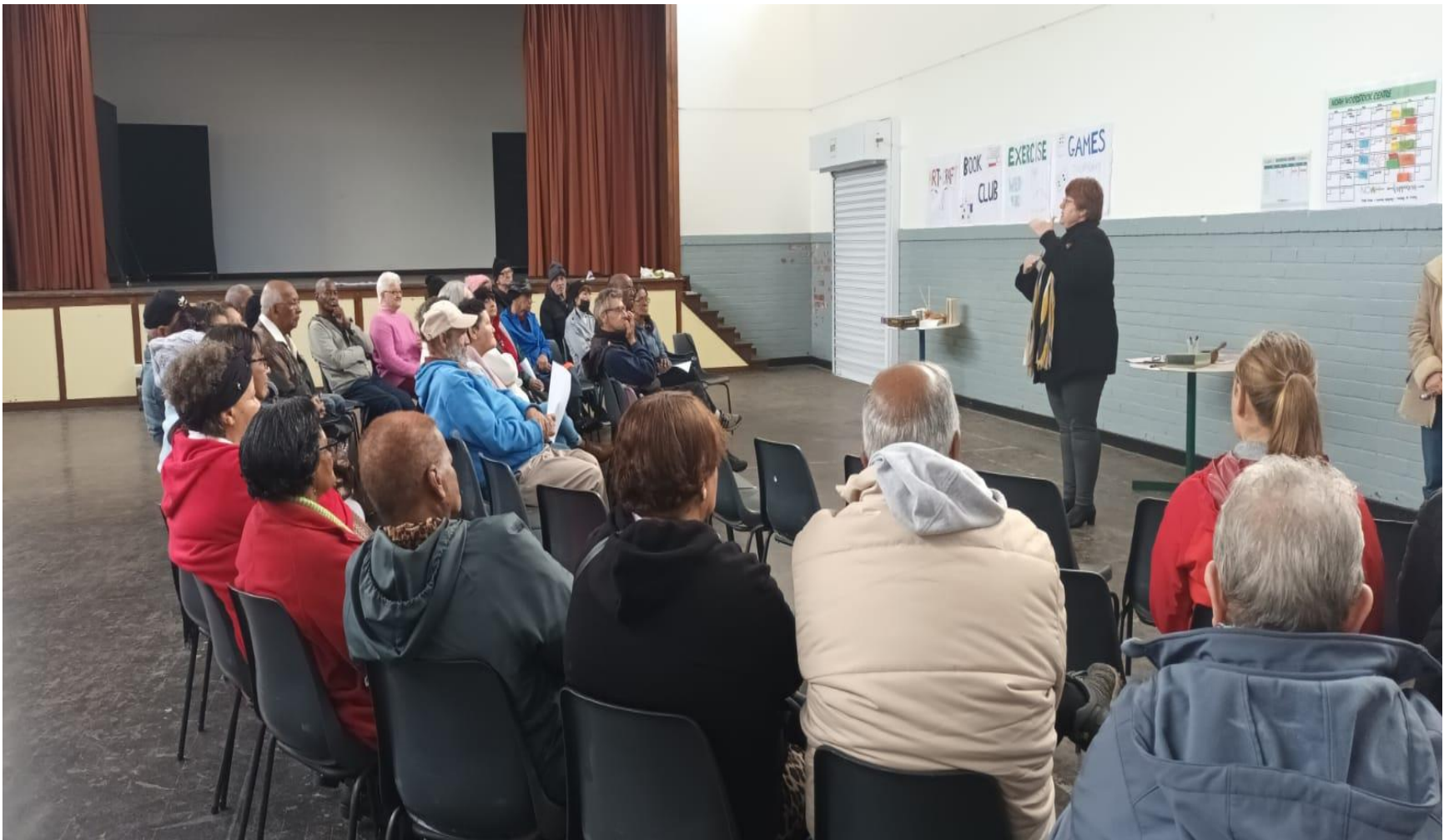
All In im August