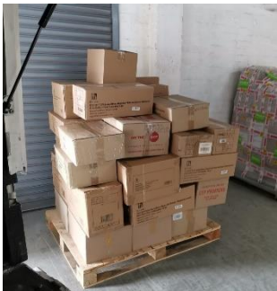
Das sind alles Bücher für NOAH

Für manche ein Geschenk für andere eine Diffarmierung.