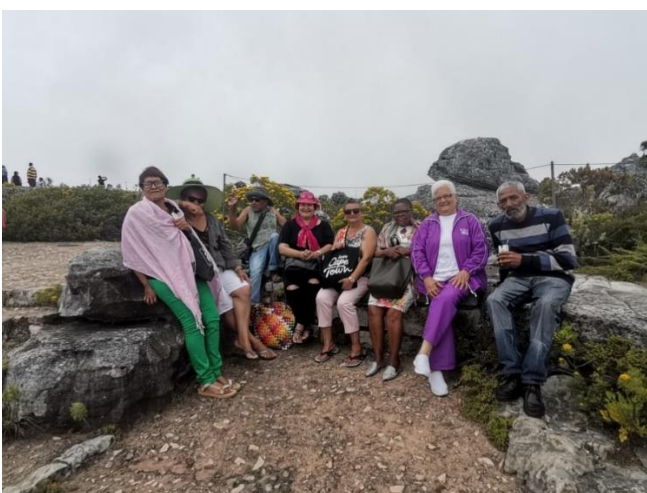
Table Mountain Trip