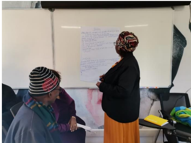
Jährliches Evaluieren der verschiedenen Bereiche in NOAH