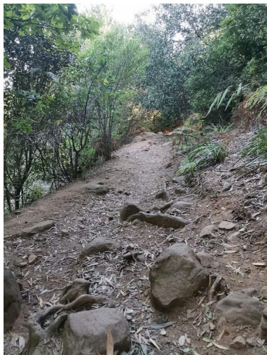
Wanderweg im Newlands Forest

-Les Brown, amerikanischer Motivationsredner