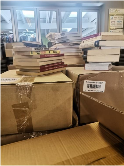
28 Boxen voll mit Büchern von Bargin Books SA