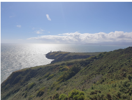
Howth Cliff Walk

Hier ein paar der Orte, die ich besuchen konnte und bis zum nächsten Rundbrief ^^