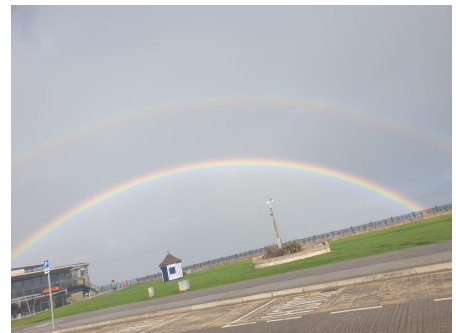
Bray hier habe ich zum ersten Mal einen doppelten Regenbogen gesehen