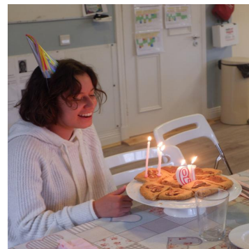
14.09. - mein 19. Geburtstag in der Arche

Partys und Feiern sind ein wichtiger Bestandteil des Lebens in der Arche, weil auch diese Zeichen des Beisammenseins sind. Also gibt es zum Beispiel eine Party wenn jemand Geburtstag hat oder Partys, wie eine die wir vor gar nicht allzu langer Zeit hatten: Halloween Party.