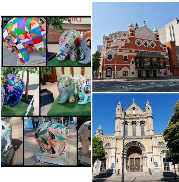
Momente von unserer Stadtbesichtigung in Belfast. Überall in der Stadt sind die

Das tolle an Belfast ist, dass es für Nordirland eine große Stadt ist, man aber trotzdem häufig immer wieder den selben Leuten über den Weg läuft.