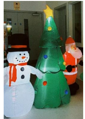
Christmas at Crawfordsburn