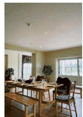
Zwischenseminar in Slane