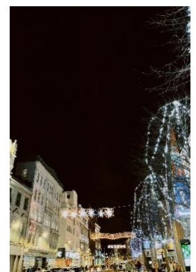
Weihnachtsstimm- ung in Belfast