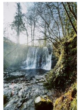
Wasserfall im Glenariff Forest Park