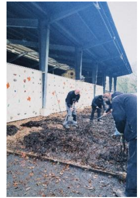
Arbeiten beim Crate-Climbing

Dort nutzen wir die fünf Tage für einen Rückblick auf die vergangenen sechs Monate und blickten in die Zukunft. Zudem beschäftigten wir uns mit Themen wie Rollen und Partizipation, Demokratie und Klima(un)gerechtigkeit. Aber auch der Spaß kam natürlich nicht zu kurz und