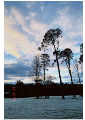
Wintermorgen im Scout Centre