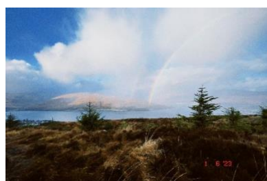
Regenbogen in Schottland