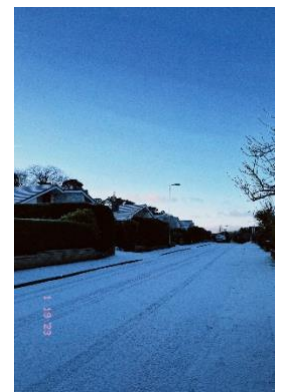
Schnee auf dem Weg zur Arbeit