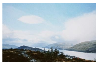
Wandern in den Highlands