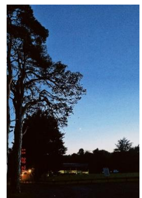
Abend im Scout Centre