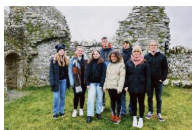
Gruppenfoto vom Seminar