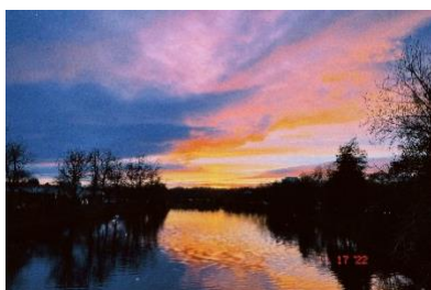
Sonnenuntergang in Belfast