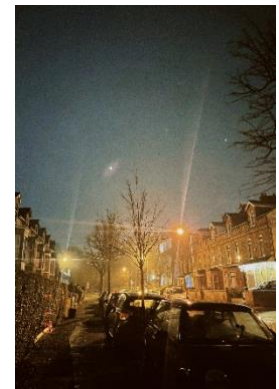
Silvester in Belfast