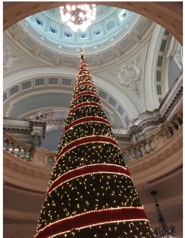
Weihnachtsbaum in Belfast

Ich habe mich sehr darauf gefreut Weihnachten mal nicht zu Hause in Deutschland zu feiern und hatte glücklicherweise die Möglichkeit mit meiner Gastfamilie und ihrer Familie zu feiern. Dazu sind wir für 2 Tage zur Familie etwas außerhalb von Dublin gefahren und haben das gemacht, was man so an Weihnachten macht: Sehr viel essen, sehr viel ausruhen und einfach mal nicht so viel tun. Somit hatte ich ein sehr schönes und entspanntes Weihnachtsfest, obwohl es ein wenig komisch war, so gar nichts festliches am 24. Dezember zu machen.