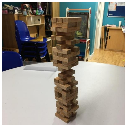
Unser Rekord beim Jenga mit einer Jugendgruppe

Das neue Jahr hat im Ozanam House ein wenig für Personalmangel gesorgt, was in einer größeren Verantwortung für mich resultierte. Somit koordiniere ich nun temporär unsere Jugendgruppen, was bedeutet, dass ich diese größtenteils vorbereite und mit der Unterstützung von Studierenden, die im Haus aushelfen, durchführe. Diese neue Verantwortung hat sich anfangs ein wenig in Stress geäußert, jedoch sind im Ozanam House zum Glück immer gute Leute, die mich unterstützen. Außerdem erfüllt es mich sehr zu sehen, wenn Kinder bei den Aktivitäten Spaß haben, die ich selbst vorbereitet habe. Somit ist die Erkenntnis: Man wächst mit seinen Aufgaben.