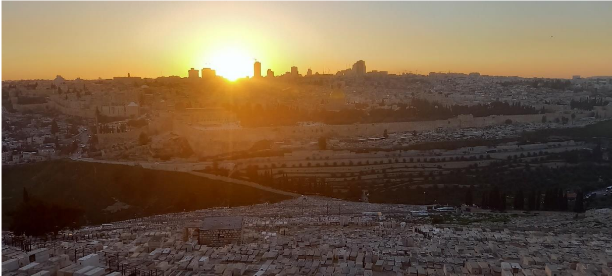
Aussicht auf Jerusalem vom Ölberg

es ist mittlerweile Juni. Das kann ich kaum fassen. Die letzten Monate und insbesondere die Zeit seit meinem letzten Rundbrief, sind für mich wie im Flug vergangen. Nun ist es Zeit für meinen letzten Rundbrief. Während ich diesen schreibe, sitze ich gerade an der Haas-Promenade und schaue auf Jerusalem. Auch nach 10 Monaten bin ich jedes Mal fasziniert, wenn ich auf die Stadt schaue und den Felsendom sehe. Gerade jetzt wo sich mein Freiwilligendienst zu Ende neigt, habe ich immer wieder das Bedürfnis die Schönheit Jerusalems zu genießen. Häufig gehe ich z.B. zum Ölberg oder anderen Aussichtspunkten, um den Sonnenuntergang zu sehen. Ich glaube das ist einer meiner Wege Jerusalem so langsam Tschüss zu sagen.