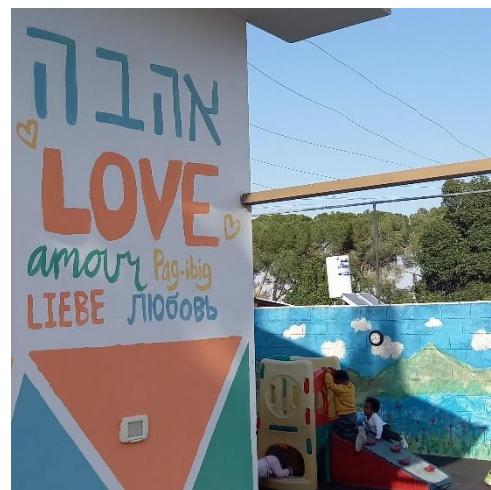
Dies ist die erste Wand, die Menschen sehen, wenn sie das Gelände des Saint Rachel Center betreten. Liebe und Dankbarkeit ist auch das, was ich empfinde, wenn ich an die vielen kleinen und großen Situationen und Begegnungen, die ich hier im Saint Rachel Center im Laufe des letzten Jahres erleben durfte, denke.