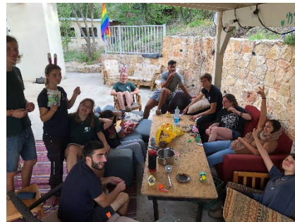
Oben: Osterversuche für die Shinshinim Rechts: Falafel-Hummus-Pita-Abend