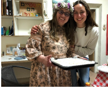
Auf Sivans Geburtstagsparty