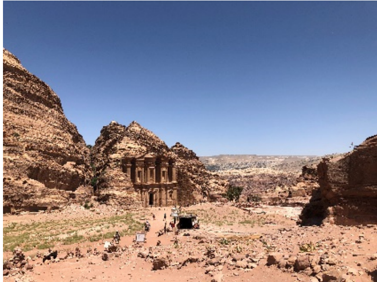
Oben: Petra, unten: Wadi Rum