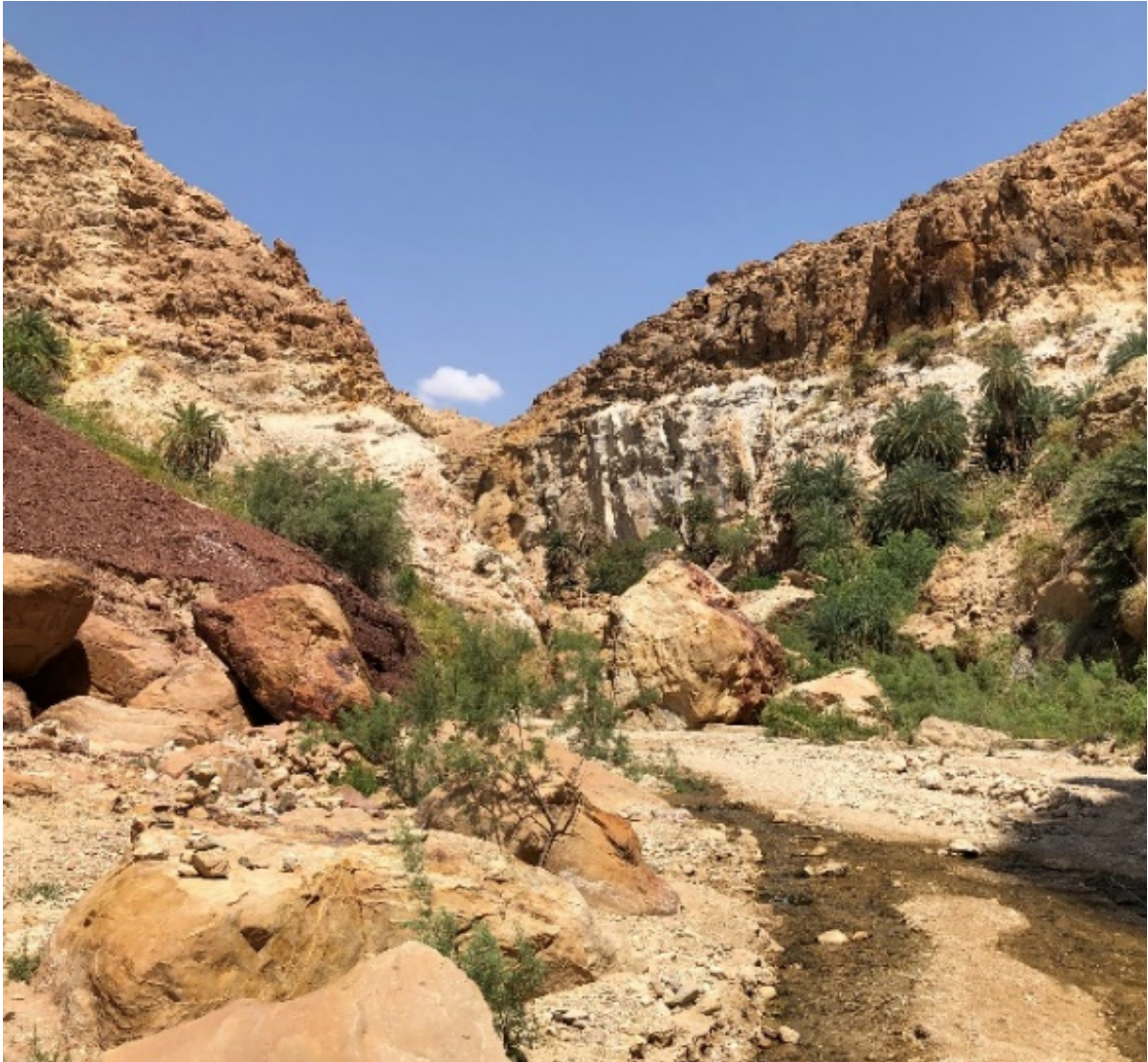
Im „Wadi Attun“ am Toten Meer