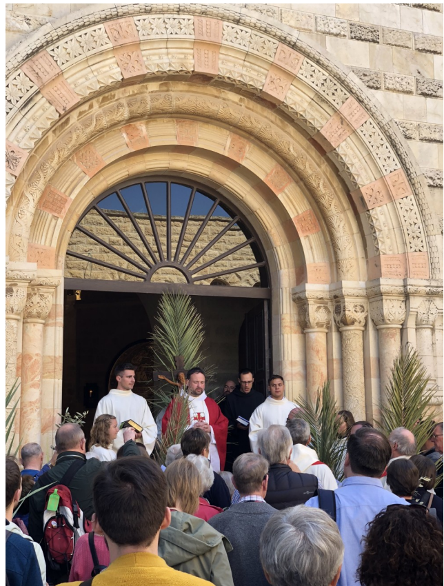
Palmsonntag in der Dormitio Abtei

Ostern ist auch der Zeitpunkt, ab dem die Sonntagsmessen nicht mehr in der Kirche, sondern in draußen am See bei Dalmanutha, der Gebetsstelle am Kinneret.