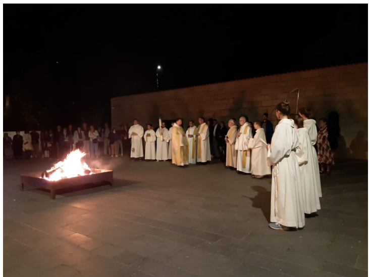
Osternacht in Tabgha