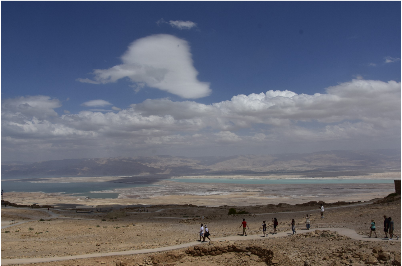
Das tote Meer von Masada aus

haben wir uns mit ihm an der selben Bushaltestelle getroffen und sind mit ihm in ein Kibbutz gefahren um Kaffee zu trinken. Er hat viel davon erzählt, dass er oft in Deutschland, Österreich und der Schweiz war und dort viele Menschen kennt. Später sind wir dann zu ihm nach Hause, wo ein altes Auto hinter dem anderen steht und allerlei Dinge überall herumstehen. Er hat uns auch in seinem Ort herumgeführt und wir haben einen sehr schönen Nachmittag verbracht bis er uns zurück nach Tabgha gebracht hat.