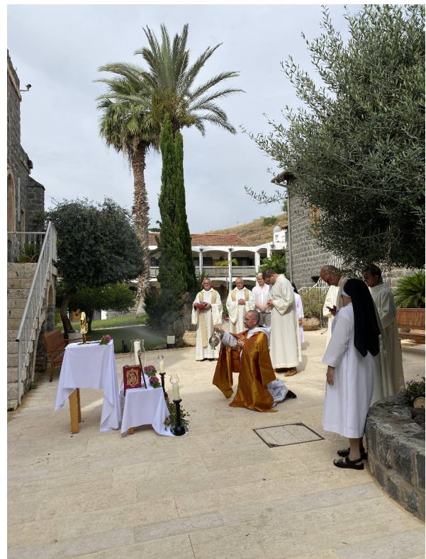
Fronleichnam im Pilgerhaus

Ein letztes Mal verabschiedete ich mich hiermit aus Tabgha bei Ihnen, hoffe dass es interessant war und wünsche Ihnen alles Gute und Gottes Segen.