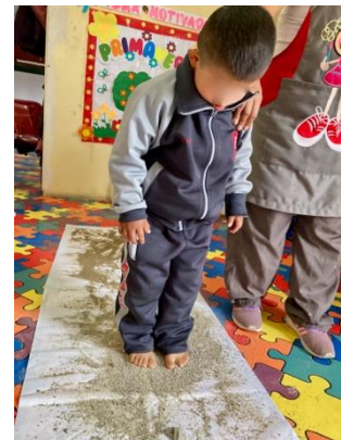
Abbildung 11: Kind auf Barfußpfad (clases especiales; inicial 1)

Zurück im Klassenzimmer wird mit gespannten und hungrigen Blicken gewartet bis alle ihr Essen vor sich haben. Einige der Kinder können alleine essen, andere brauchen dabei Unterstützung. In jedem Fall wird das leckere Essen von Mama, bei dem von Muffins über Kartoffeln mit Ei oder Pancakes alle Köstlichkeiten vertreten sind, zusammen genossen. Und auch ich bekomme ab und zu einen Muffin von meiner Kollegin mitgebracht, die in der Schule als beste Bäckerin bekannt ist und darf so mit den Kindern gemeinsam die Lonchera genießen.