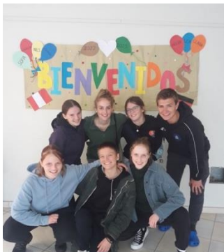
Abbildung 1: Freiwilligengruppe nach der Ankunft in Lima

Die Vorbereitung begann also von Neuem. Online Treffen im Februar, um die neue Gruppe kennenzulernen. An Pfingsten das erste Ausreiseseminar, diesmal tatsächlich in Präsenz. Nach einer intensiven Woche mit Themen wie Rassismus, Gender und Lebenswege, freuten wir uns alle auf ein Wiedersehen fünf Wochen später auf dem zweiten Ausreiseseminar. Doch auch dieses sollte für mich mit schlechten Neuigkeiten beginnen. Mir wurde gesagt, meine Einsatzstelle sei geschlossen und ich könne meinen Dienst dort nicht beginnen. Das hieß, vier Wochen vor Ausreise wieder neu orientieren. Das Einzige, was über die ganze Zeit der Vorbereitung sicher schien, brach nun auch noch weg. Ich musste mich für eine neue Einsatzstelle entscheiden. Nach einer Woche Bedenkzeit entschloss ich mich schließlich auf mein Bauchgefühl zu hören und entschied mich für das Colegio Fe y Alegría No.37 in Lima.