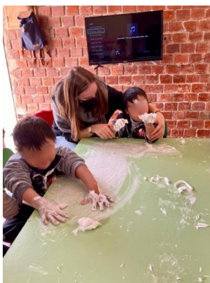
Abbildung 12: Kinder beim Entdecken von Schaum (clases especiales, inicial1)

Nachdem sich Alle gestärkt haben, steht meist eine Freispielphase im Raum nebenan auf dem Plan. Der Raum bietet viel Platz zum Bewegen, bietet eine Auswahl an Musikinstrumenten, Bällen und Büchern an, sowie große Bauklötze zum Höhle bauen. In dieser Zeit beaufsichtige ich die Kinder und achte darauf, dass alle Schüler*innen im Raum bleiben und sich keine*r verletzt. Natürlich wird auch fleißig gemeinsam mit den Kindern gespielt oder auch mal ein bisschen rumgealbert. Die Lehrerin ergänzt in dieser Zeit die Hefte der Kinder mit den gestalteten Arbeiten des Tages.