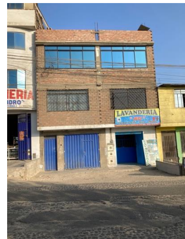
Abbildung 4: Außenansicht von meinem Haus

Meine Gastfamilie tut aber alles was möglich ist, damit ich mich wohl fühle und kümmern sich ganz lieb um mich. Das wohl Wichtigste ist, dass ich nicht verhungere. Es wird immer darauf geachtet, dass ich lieber einen Löffel zu viel als zu wenig auf dem Teller habe. Am Ende dieses Jahres in Peru werde ich wahrscheinlich zum Flughafen rollen, denn es ist wirklich schwer bei dem ganzen leckeren Essen nein zu sagen und aufzuhören. Die erste Frage, die gestellt wird, wenn ich alleine zuhause war, „Hast du auch was gegessen Kind?“. Wenn ich diese Frage nicht direkt mit einem ja beantworte heißt es direkt „sientate hija“ – Setzt dich Kind. Und es wird erstmal dafür gesorgt, dass das nachgeholt wird. Ihr seht also, Essen spielt hier eine sehr große und wichtige Rolle. Die Mahlzeiten werden, soweit es möglich ist, in meiner Familie immer gemeinsam eingenommen. Unter der Woche ist das durch die unterschiedlichen Arbeitszeiten nicht immer möglich, aber zumindest am Wochenende wird darauf viel Wert gelegt. Und wenn wir einen Ausflug machen, in einen Park oder ein