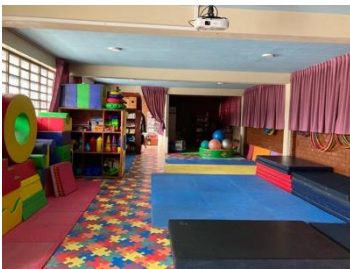
Abbildung 7: Freispiel- und Physiotherapieraum

Ich absolviere meinen Freiwilligendienst im Colegio Fe y Alegría No.37 in San Juan de Lurigancho-Montenegro.