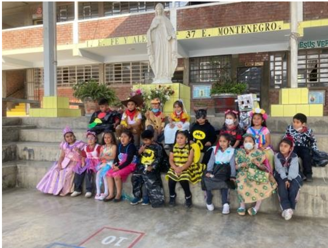
Abbildung 13: Projektabschluss Recycling, Kinder der primaria

Um halb drei warten hier schon die Kinder der ersten Klasse auf mich. Ich rotiere hier durch die fünf