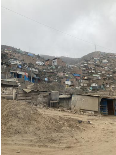
Abbildung 2: alternative Stadtrundfahrt San Juan de Miraflores