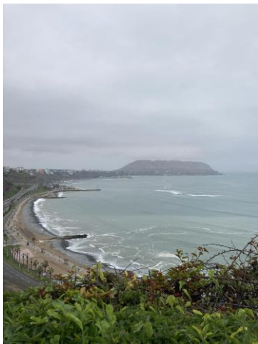
Abbildung 3: Küste von Lima

Am Donnerstagabend machte die Gruppe „Kilombo“ mit uns Musik. Zunächst mussten wir ein wenig Gefühl für Takt und Rhythmus entwickeln, indem wir uns zu einem auf einer Trommel gespielten Takt durch den Raum bewegten. Anschließend durften wir selbst ein wenig auf den Trommeln experimentieren. Jeder auf seiner eigenen Trommel und so laut wir konnten. Und auch wenn wir Freiwilligen im Vergleich zu „Kilombo“ eher etwas hüftsteif waren, war das wohl der einzige Zeitpunkt zu dem uns nicht kalt war in dieser Woche.