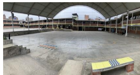
Abbildung 8: Schulhof colegio Fe y Alegria No.37

Zweifel, ob ich das überhaupt alles irgendwie schaffen kann. Denn ich hatte bis zu diesem Zeitpunkt noch keinerlei Erfahrungen mit niños especiales gemacht. Daher fiel bzw. fällt mir der Umgang mit ihnen nicht immer leicht, vor allem mit den schon etwas älteren Kindern. Vor allem am Anfang war es eine Herausforderung, wie ich mit den Schüler*innen arbeiten soll und wie ich sie unterstützen kann. Schließlich kannten sie mich nicht und waren deshalb zu Beginn etwas verhalten mir gegenüber. So kam es zu Beginn öfter vor, dass ich nur eine beobachtende Rolle einnahm und nicht viel helfen konnte.