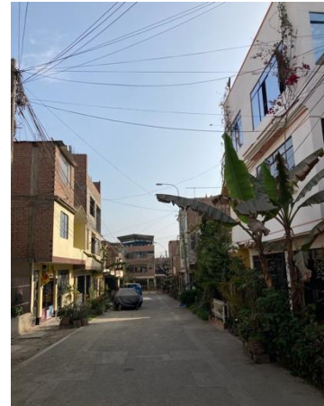
Abbildung 6 : Motupe- San Juan de Lurigancho