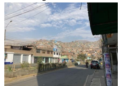
Abbildung 5: Blick in die Nachbarschaft