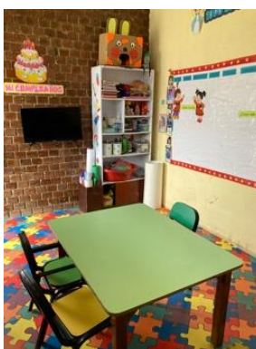
Abbildung 9: Klassenraum niños especiales inicial 1

Dies änderte sich, als ich in die Klasse der kleinsten niños especiales kam. In dieser Klasse sind die Kinder 4 und 5 Jahre alt. Mir fiel es von Anfang an leichter einen Zugang und eine Verbindung zu diesen Kindern aufzubauen, sodass ich seither in dieser Klasse unterstützend tätig bin.