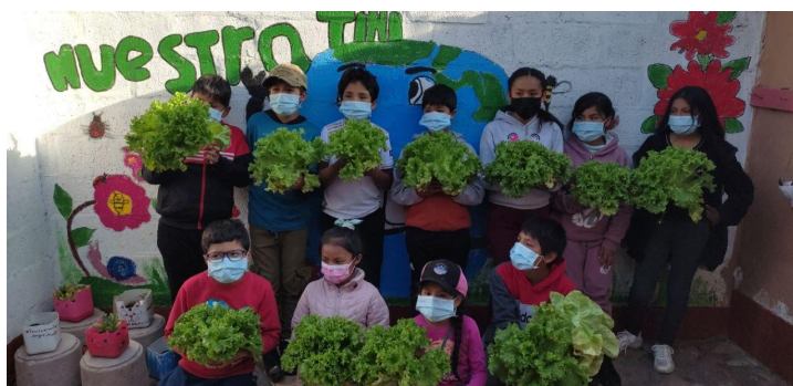
Die Tini Gruppe

In der restlichen freien Arbeitszeit unterstütze ich die Schwestern bei den Kampagnen Arbeiten im Büro.