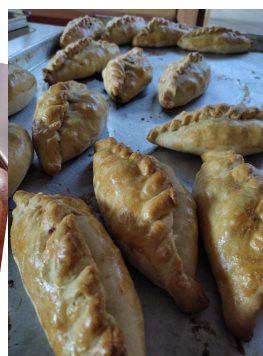
Produkte der Bäckerreischulung