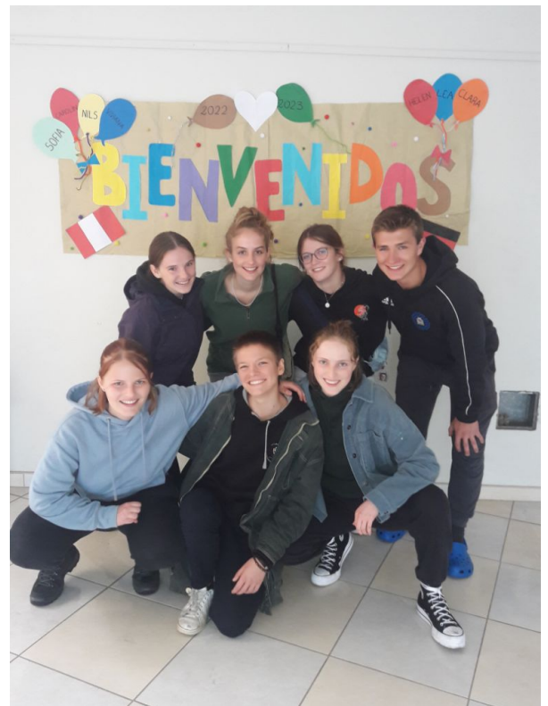
Ankommen in Lima