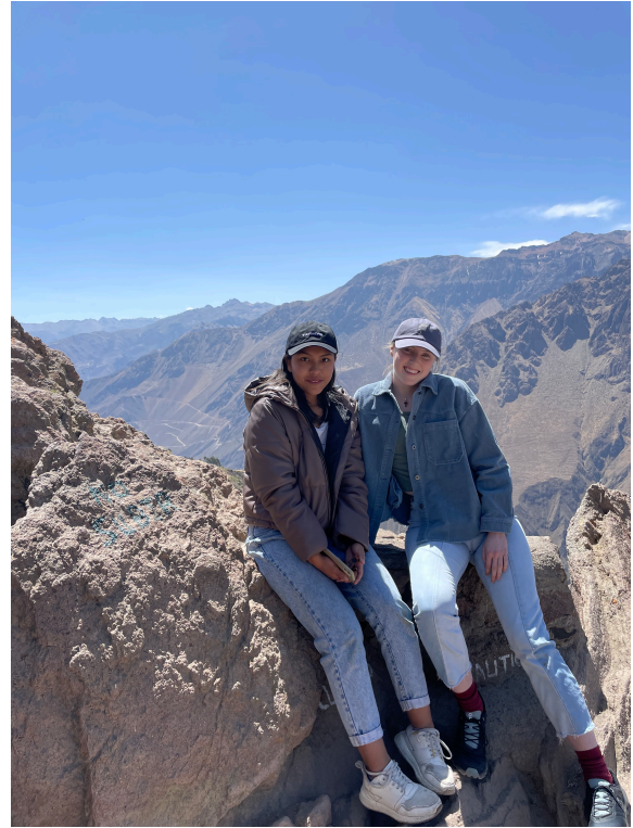
Die Inkaterrassen und meine Gastschwester und ich am Cruz del Condor