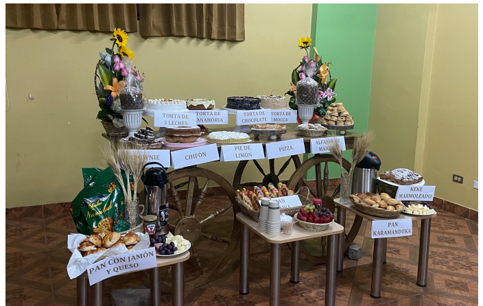
Präsentation des Bäcker*innen Kurs

Außerdem hat die Caritas ein Projekt, in dem Köch*innen und Bäcker*innen Kurse geben, wie man ein Event mit Catering vor- und zubereitet. Zusammen mit meiner Chefin und Kolleg*innen durfte ich zu Abschlüssen dieser Kurse fahren, bei denen die Teilnehmer*innen das Gelernte zeigten. Wie sie ihre Location hergerichtet hatten und die Gerichte, Getränke, Gebäcke, Kuchen und Torten, die sie kochen und backen gelernt haben. Alle Teilnehmer*innen haben ein Zertifikat bekommen, dass sie ein Event vorbereiten können, Schürze, Kopfbedeckung, Maske und eine Geschenküte mit einer Auswahl an Koch- und Backmaterialien. Danach durfte das Zubereitete probiert und gegessen werden und es gab Zeit sich gegenseitig auszutauschen. So hatte ich die Möglichkeit, mit den Köch*innen und Bäcker*innen, die den Kurs anleiteten, zu reden und das ein oder andere Rezept auszutauschen.