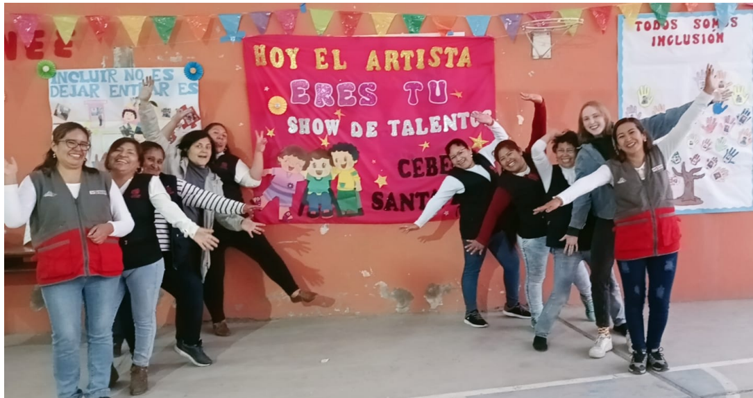
Alle Lehrerinnen und Aushilfen der Schule Santa Ana nach der Talentshow Auf dem Plakat steht: Heute bist du der Künstler - Talentshow Cebe Santa Ana

Am Freitag, dem letzten Tag dieser besonderen Woche, gab es eine Party in der Schule, alle haben getanzt, pollo a la brasa (Hühnchen mit Pommes), Eis und Torte gegessen. Ein paar Kinder haben noch einmal ihren Auftritt der Talentshow gezeigt.