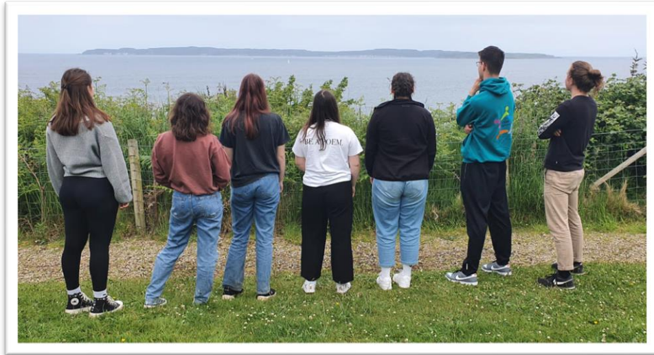
Abbildung 2 Gruppenfoto vom Seminar

irische Flagge zusehen. Das Kleeblatt und die Farbe Grün stehen für das Symbol des Schutzpatrons. Meine Freunde und ich haben von einer Frau, die neben uns stand, einen kleinen Sticker geschenkt bekommen. In Form eines Kleeblattes und in den Farben der irischen Flagge, die wir uns in das Gesicht kleben konnten. Die Parade war sehr bunt und die Menschen hatten aufwendige Kostüme an, das hat mich an einen Fasnachtsumzug erinnert.