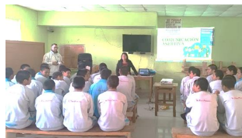
Im „Centro Juvenil“ (Jugendgefängnis)

Es gibt auch Aktionen, die alle Kommissionen in PASSDIH zusammen durchführen. So fand im September die „Semana Social“ (= soziale Woche) statt, in der jeden Tag alle gemeinsam in ein anderes Dekanat gefahren sind, um Vorträge und Workshops zu den Themen der verschiedenen Kommissionen anzubieten.