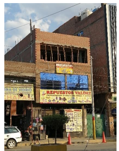
Das Haus mit Laden (gerade in Renovierung)