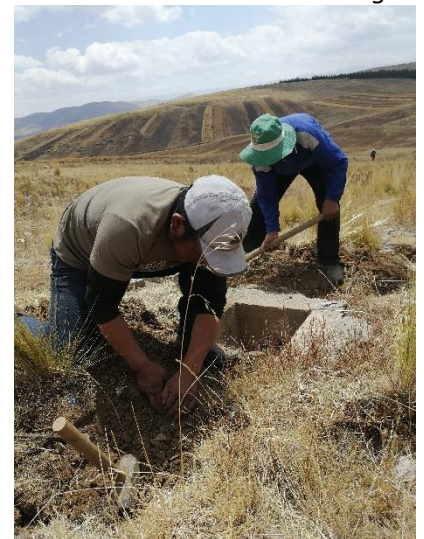
Beim Bau einer Wasserleitung