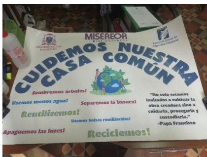
Erstelltes Plakat für eines der Projekte