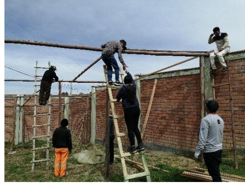
Konstruktion eines Gartenhauses