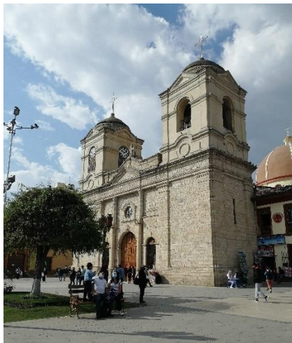
Kathedrale von Huancayo

Wie schon mehrfach erwähnt, lebe ich in Huancayo. Huancayo ist eine 350.000-Einwohner-Stadt östlich von Lima in den Anden auf 3.250 Metern Höhe. Beim Sport macht mir die Höhe immer noch ziemlich zu Schaffen :). Mir gefällt die Stadt sehr gut: Es gibt alles hier, vom riesigen Markt mit tausenden Früchten und Gemüsesorten, die ich noch nie gesehen habe, bis zum Einkaufszentrum mit H&M und Starbucks. Alles ist irgendwie nach Themen sortiert: Es gibt Straßen, in denen es zum Beispiel nur gravierte Stempel zu kaufen gibt und einen ganzen Block, in dem es nur Fisch-Restaurants gibt. In der Umgebung von Huancayo gibt es sehr viele schöne Ecken in der Natur, von alten Terrassen zum Lebensmittelbau der Huancas (von ihnen kommt der Name Huancayo) bis zu Lagunen auf bis zu 5000 Metern Höhe. Ein Spruch, der hier gängig ist, lautet: „Ich hoffe, dein*e Partner*in ist nicht wie das Wetter von Huancayo“. Denn mittags kann es kurze-Hosen-Wetter haben mit starker Sonnenbrand-Gefahr, eine Stunde später regnet es in Strömen, danach stürmt es und nachts gibt es Hagel.