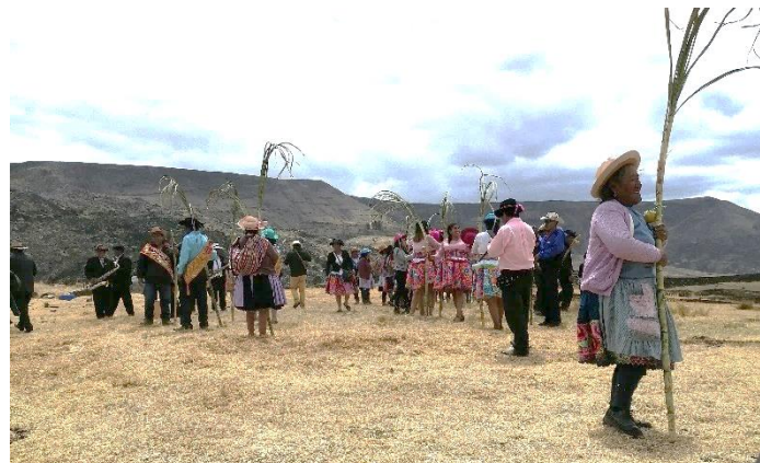
Bei einem Tanz mit Zuckerrohr und Orangen am Feiertag „Santa Rosa de Lima“ im Dorf meiner Gastmutter

Aber auch in Huancayo selbst gibt es eigentlich jedes Wochenende ein Familienfest, denn allein väterlicherseits gibt es 35 Gastcousins und 52 Gastneffen/-nichten. Mein bisheriges Lieblingsfest war eine Feier, bei der die Trauzeugen eines Hochzeitspaares mit Geschenken „überredet“ wurden, ihre Aufgabe anzunehmen. Eines der Geschenke war ein Schaf!