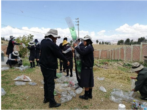
Schüler*innen bei der Arbeit