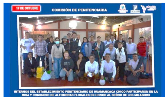
Im Herrengefängnis von Chupaca an bei einer Feier