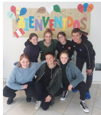
Wir sieben Freiwilligen nach der Ankunft in Lima

*: mit dem Ausdruck „schwarz“ und „weiß“ beziehe ich mich auf ein menschengemachtes rassistisches Konstrukt, das Privilegien sowie Machtgefälle widerspiegelt und NICHT den tatsächlichen Ton der Haut.