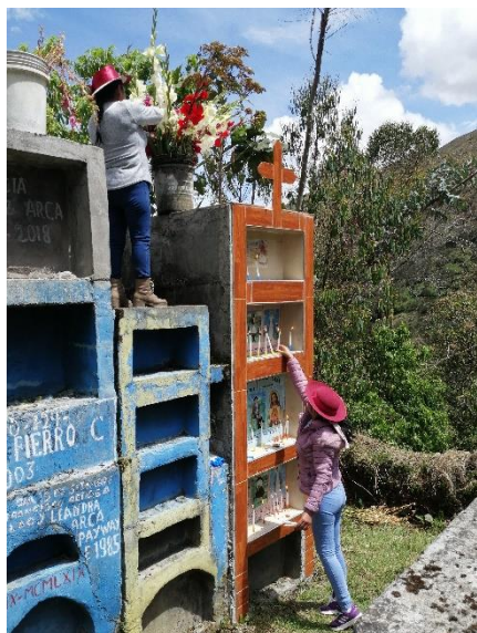
Beim Grab dekorieren an Allerheiligen im Dorf meines Gastvaters

Meine Gasteltern kommen ursprünglich aus jeweils unterschiedlichen Dörfern, die ziemlich tief in den Anden liegen. Dort durfte ich an verschiedenen Feiertagen mit auf die jeweiligen Familienfeste, was für mich eine sehr schöne und aufregende Erfahrung war.