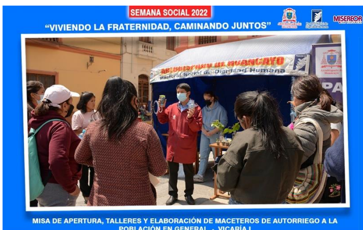
Bei einem Workshop mit Pflanzen vor der Kathedrale Huancayo in der „Semana Social“ Bezirk 1