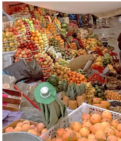
Markt in Huancayo