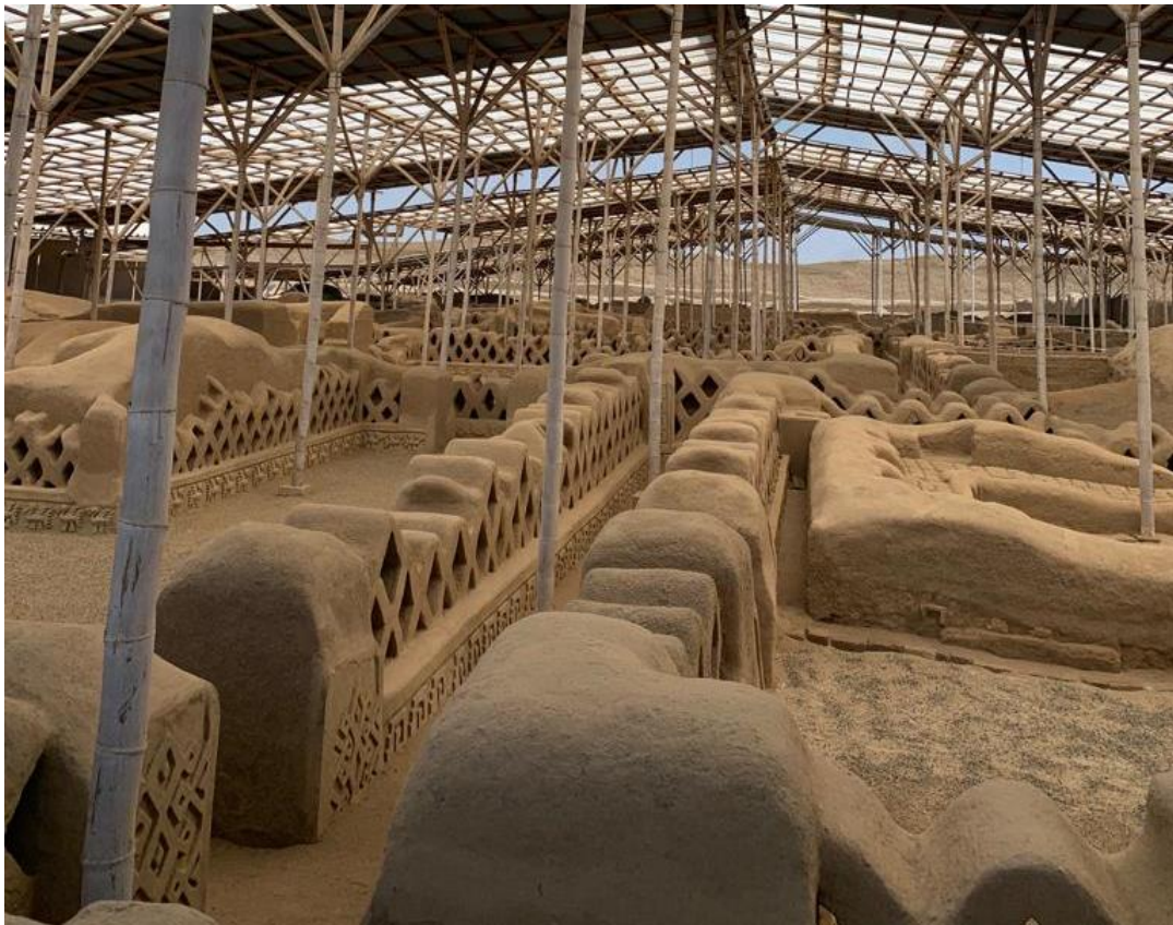
Stätte Chan Chan in Trujillo