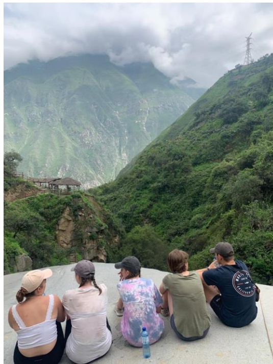
mit den Freiwilligen wandern

Es ist tatsächlich schon eine ganze Weile her, dass ich den letzten Rundbrief geschrieben habe und somit muss ich erst einmal wieder in den Schreibfluss kommen. Ich sitze gerade auf unserem Sofa in Ayas und überlege wie ich es schaffe, all das, was seit dem letzten Mal passiert ist, interessant und möglichst kurz hier reinzupacken. Es ist einfach so viel in allen Bereichen geschehen, dass ich manchmal selbst innehalten muss damit nicht alles einfach an mir vorbeizieht.