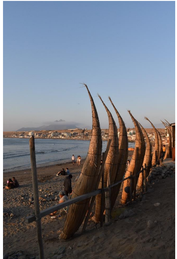
caballos de totora

interessiert, welches ca. 30 mit Bus von Trujillo entfernt ist. Dort hatten wir unser Apartment und außer ein zwei Tagestrips sind wir auch die meiste Zeit dort geblieben, haben entspannt und gesurft. Huanchaco ist in Peru sehr bekannt für seine caballos de totora (Schilf-pferdchen) welches spezielle Fischerboote sind, mit denen die Einheimischen Fische/ Krebse und andere Meerestiere fangen. Neben einem Tagestrip Stadtbesichtigung nach Trujillo, ging es für uns auch zur Stätte Chan Chan, welches Ruinen einer früheren Stadt der Chimukultur sind. Das Weltkulturerbe besteht größtenteils aus den alten Lehmbauten mit einem zusätzlichen Museum, welches noch ein paar klarere Eindrücke gibt. Denn ehrlich gesagt, ohne Guide hätten wir die riesigen Tempelanlagen gar nicht verstanden. Doch so war es im Endeffekt sehr informativ und das ganze Laufen wert. Die Woche mit den anderen Freiwilligen war auf jeden Fall eine sehr schöne Abwechslung von der Zeit in Ayas und Chosica