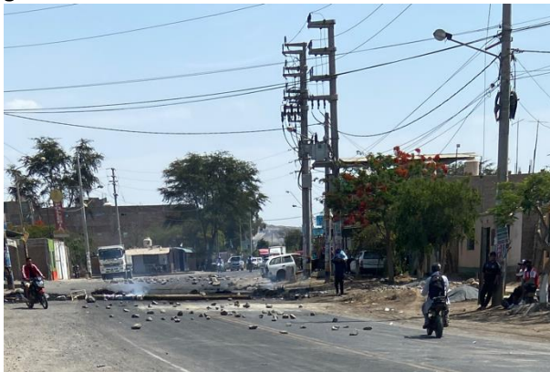
Abbildung 4: Straßenblockade bei Ica

Seine Vizepräsidentin Dina Boluarte wird daraufhin als erste Frau zur Staatschefin von Peru ernannt. Seit diesem Tag verschärfte sich die Situation immer weiter und viele Anhänger*innen Castillos gehen bis heute auf die Straße um seine Freilassung, die Absetzung Boluartes und Neuwahlen zu