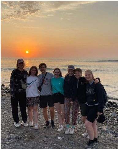
Abbildung 1: Freiwilligengruppe im gemeinsamen Urlaub