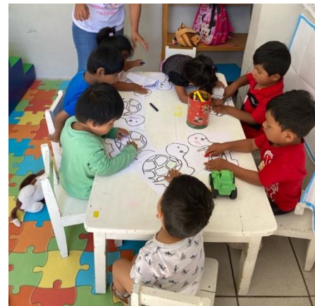
Abbildung 9: 2 - 4 jährige beim Malen

Einmal in der Woche stand ein Ausflug entweder an den Strand oder ins Schwimmbad an. Das stellte jede Woche das Highlight für die Schüler*innen da. Die Kinder haben es genossen einmal in der Woche rauszukommen und sich richtig auszuupern. Und natürlich war der Spaß immer besonders groß, wenn es ihnen gelungen ist eine*n der Lehrer*innen nass zu machen.