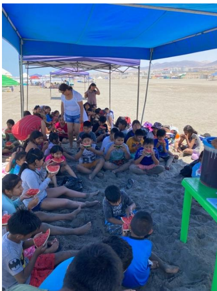
Abbildung 10: Mittagssnack beim Ausflug an den Strand

Bevor die Kinder nachmittags wieder nachhause gebracht werden, gab es um 13 Uhr noch Mittagessen für alle.