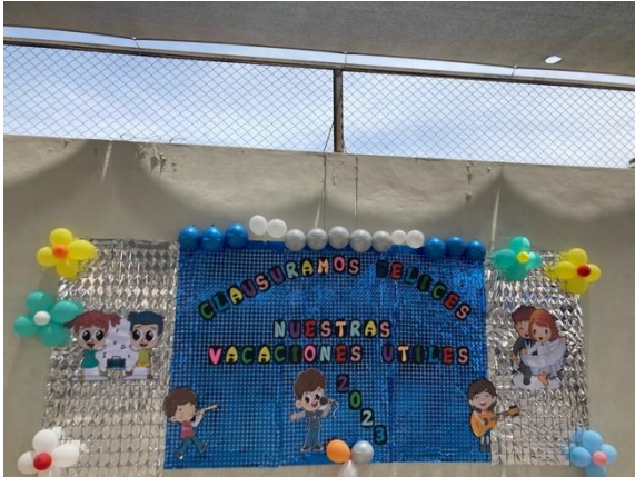
Abbildung 8: Abschluss der vacaciones útiles

In den folgenden sechs Wochen, habe ich die Kinder und Kolleg*innen bei gemeinsamer Zeit in den Klassenräumen, bei Ausflügen oder Faschingsfeiern immer besser kennenlernen dürfen.