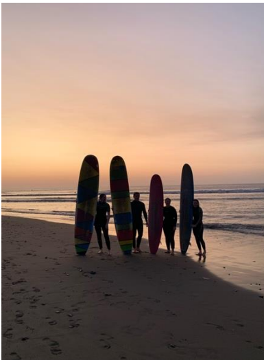
Abbildung 3: Nach der ersten Surfstunde

Am Tag nach dem Seminar ging es für uns sieben Freiwilligen los in unseren ersten Urlaub, denn die 3-monatige Eingewöhnungsphase, in der kein Urlaub und kein Besuch erlaubt war, war endlich vorbei.