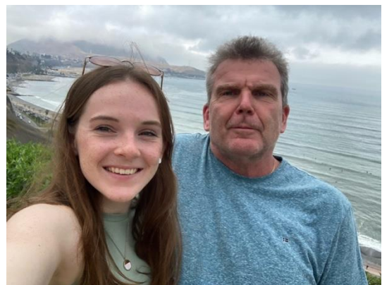
Abbildung 5: Mein Papa und ich an der Costa Verde

Dann endlich, am 16.12 wurde die Panamericana in Richtung Lima wieder geöffnet. Mein Papa konnte sich auf den Weg machen und traf am frühen Nachmittag bei mir ein. Unsere geplante Reise in den Süden konnten wir aufgrund der anhaltenden Proteste und Unsicherheiten nicht antreten. Deshalb buchten wir spontan ein kleines Apartment in Barranco. Wir hatten uns Barranco, Miraflores, das historische Zentrum von Lima und natürlich auch die Küste angesehen und hatten so dennoch eine schöne Woche zusammen verbracht. Der erneute Abschied war nicht leicht, trotzdem hat mir die Woche wieder ein bisschen Energie gegeben.