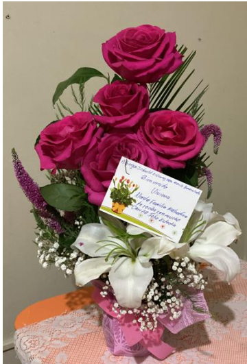
Abbildung 6: Blumenstrauß zur Begrüßung

Der Chef der Einrichtung César Augusto Loarte Cueva bot mir daraufhin an, in den Süden Perus zu kommen und mir die Einrichtung anzusehen. Aufgrund von Streiks platzte mein ursprünglich im November 2022 geplanter Besuch. Doch jetzt endlich sollte es soweit sein. Ab dem 16.01 warteten