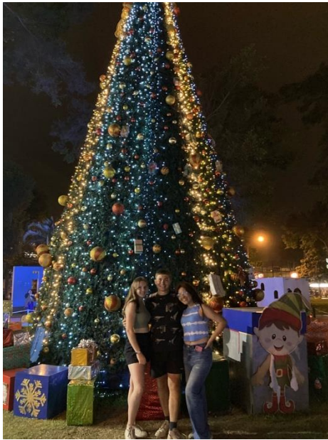
Abbildung 12: Weihnachten in Miraflores