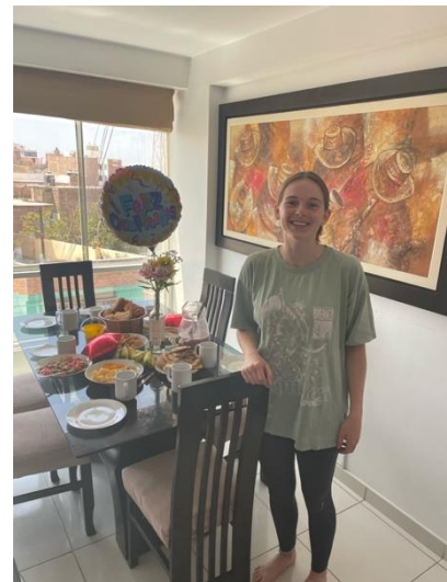
Abbildung 2: Mein Geburtstag

Am Ende der Woche, die viel zu schnell rum ging, hieß es dann Adíos nos vemos pronto! (wir sehen uns bald !)