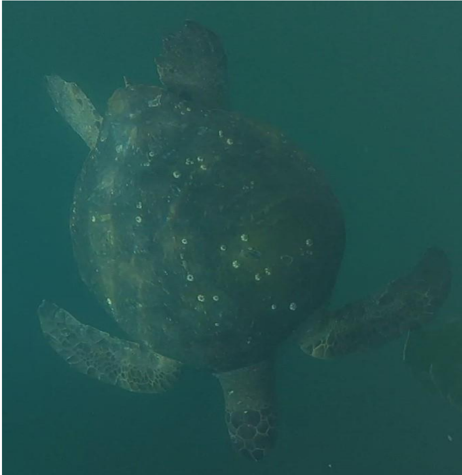
Ecuador - Meeresschildkröte