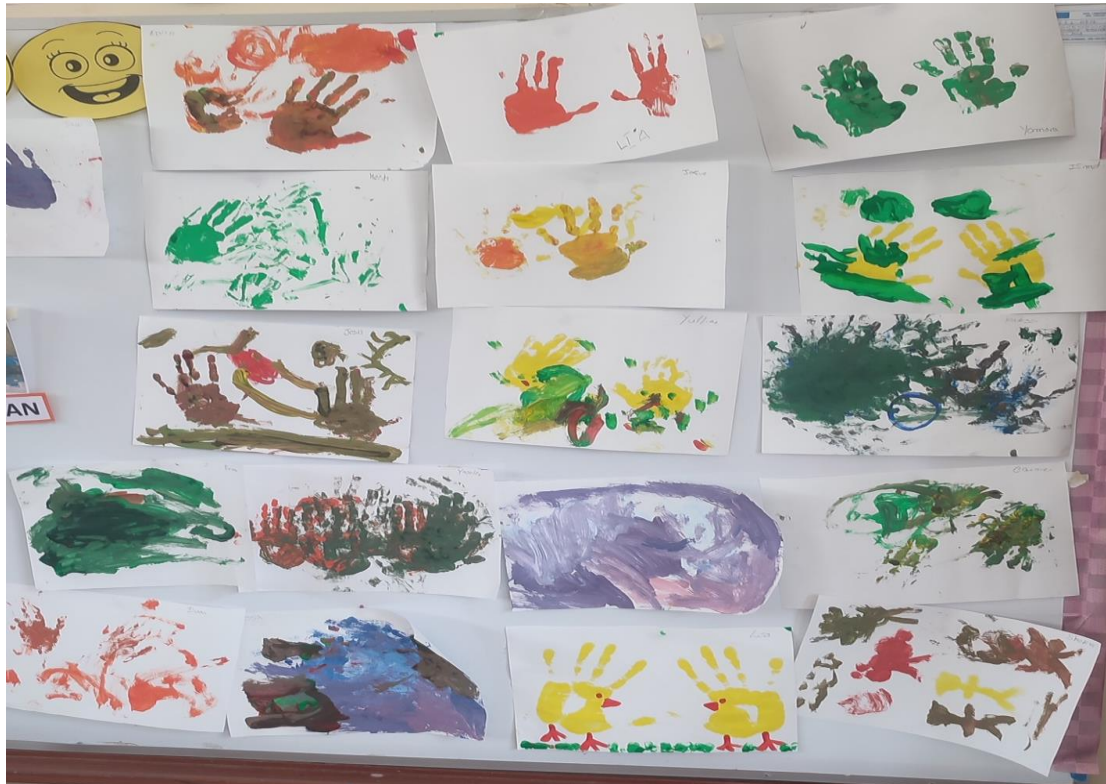
Inicial (dt. Kindergarten) Handabdrücke Tiermotive

Donnerstags bin ich zuerst bei den Kindern der Inicial (dt. Kindergarten) und male und bastel etwas, was ich mir zuvor überlegt habe. Im zweiten Teil des Tages gehe ich in die Aula der 5. und 6. Klasse. Freitags habe ich zuerst die Kinder der 3. und 4. Klasse und anschließend der 1. und 2. Klasse. Zwischendurch unterstütze ich die Lehrkräfte damit, dass ich ihnen den Sport Unterricht abnehme und dafür mit den Kindern ein paar sportliche Einheiten und Bewegungen durchführe. Bei diesen handelt es sich dann um Ausdauer und Schnelligkeit, sowie Kraft und Beweglichkeit.