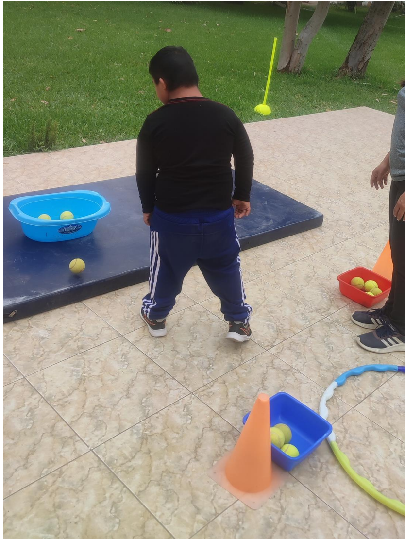
Koordinationsübungen draußen im Garten