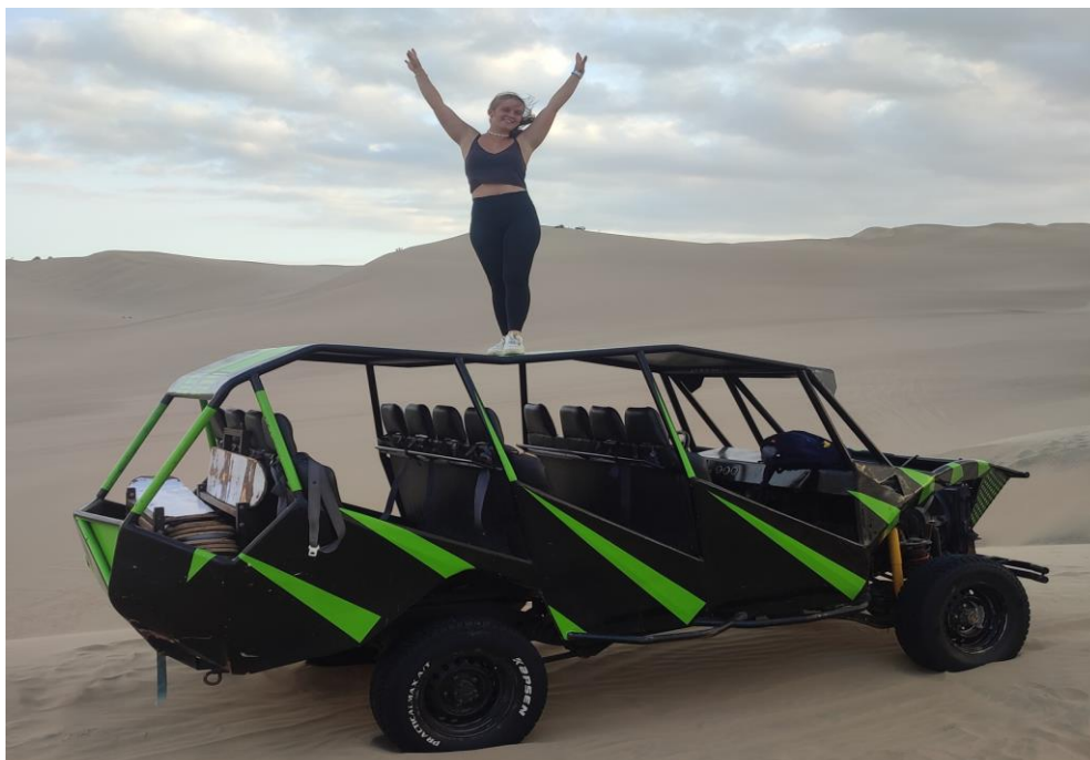
Huacachina – Ica

Ich bin mir bewusst, dass das alles nicht selbstverständlich ist, aber dennoch freue ich mich um so mehr, dass ich mir diese einmaligen Ereignisse nicht nehmen lassen habe.