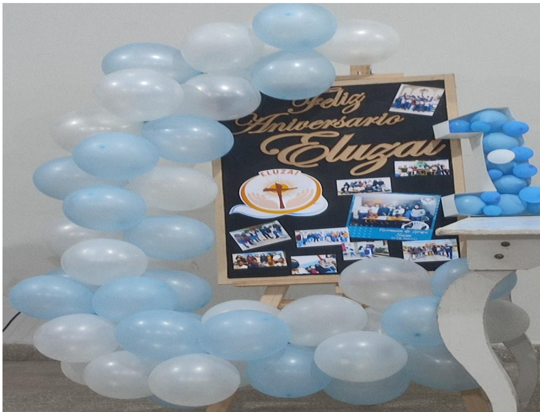
Aniversario Eluzai (Jahrestag Jugendgruppe Eluzai)

Die Jugendlichen aus der Kirchengruppe Eluzai habe ich zum Teil sehr in mein Herz geschlossen. Samstagabends besuche ich immernoch die wöchentlichen Treffen und nehme gerne an diesen Teil. Ich finde es eine schöne Abwechslung zu den Sonntagsmessen, da wir hier über kirchliche Themen reden, die sehr gut aufgearbeitet wurden und leicht verständlich sind.