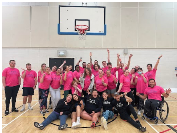
Coaches Training bei den PeacePlayers

Ich habe angefangen, mir aufzuschreiben, was Kinder mich so fragen oder was sie so zu mir sagen, da ich selbst das einfach so süß finde, dass ich das niemals vergessen will.