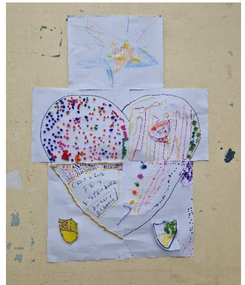
Ergebnis von einer Session am Samstag

Da die Aktivitäten zusammen mit anderen Freiwilligen allerdings nur zweimal im Monat stattfinden, unterstütze ich meine Einsatzstelle Virgen del Carmen unter der Woche ebenfalls halbtags von 9 bis 13 Uhr. Nach einer Stunde Mittagspause bin ich dann von 14 bis 17 Uhr in dem Kinderheim „Divino Jesus“, das sich nur eine Straße weiter befindet. Dazu gleich mehr.