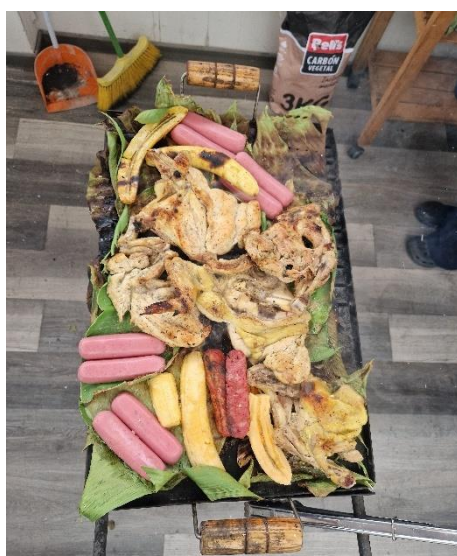
Grillen in der Gastfamilie

Insgesamt kann ich sagen, dass es bis hierher eine aufregende Zeit war. Mit vielen guten, aber natürlich auch einigen schwierigen Tagen. Umso mehr bin ich deshalb dankbar für die Menschen, die mich tagtäglich unterstützen und für das Netzwerk aus Freiwilligen, Begleitern, Familien usw., das die FIF aufgebaut hat. Es ist schön zu wissen, dass es immer einen Ansprechpartner gibt und ich in die Gemeinschaft eingebunden bin. Das gibt mir viel Halt. Ich erhoffe mir für die nächsten Monate, die Aktivitäten in meinen Einsatzstellen noch mehr nach meinen Wünschen gestalten zu können und bin gespannt darauf, was mich in nächster Zeit erwartet!