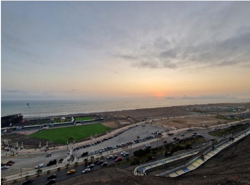
Costa Verde, nur Fünf Minuten zu Fuß von meinem Zuhause in Magdalena del Mar entfernt

Ich lebte mich schnell ein und obwohl es am Anfang extrem schwierig für mich war, Spanisch zu reden, klappte die Verständigung irgendwie. Zur Not mit Englisch oder Händen und Füßen. Nach nur kurzer Zeit lernte ich aber viel dazu und kann jetzt (fast) problemlos Gespräche führen. Ich wurde sehr lieb von allen Familienmitgliedern aufgenommen und sie bemühen sich täglich darum, dass es mir gut geht und ich mich wohlfühle. Gerade am