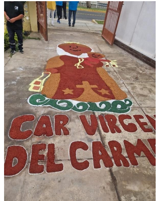
Feiertag in Peru „Señor de los Milagros“, der in der Albergue Virgen del Carmen gefeiert wurde

Falls ich nicht durch eine solche Aktivität beschäftigt bin, bin ich in meiner Tagesgestaltung sehr frei. Dann unterstütze ich die Mitarbeiter bei kleinen Erledigungen, zum Beispiel Papierkreise ausschneiden (es wird nämlich vom Pflegepersonal und den anderen Mitarbeiter*innen viel gebastelt, um das Heim schön zu gestalten) oder Akten der Abteilung der sozialen Arbeit zu organisieren. Ansonsten unterstütze ich die Pflegekräfte dabei die Bewohner beim Mittagessen zu füttern, sie zu rasieren oder die Stockwerke hoch- und runterzulaufen. Darüber hinaus unterhalten sich die Bewohner oft mit mir, ich schaue mit ihnen zusammen einen Film, höre Musik, male mit ihnen, spiele Kartenspiele oder bastle Armbänder. Je nachdem worauf sie gerade Lust haben und was an dem Tag ansteht. Dabei fällt mir die Verständigung teilweise noch etwas schwer, da manche Bewohner nur leise oder undeutlich sprechen. Trotzdem habe ich das Gefühl zu einigen bereits eine Verbindung bzw. Freundschaft aufgebaut zu haben und ich freu mich immer darüber, sie morgens zu sehen.