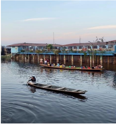
Belen während der Regenzeit