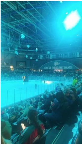
Eishockeyspiel der Belfast Giants