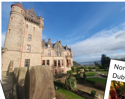
Belfast Castle mit Blick über Belfast