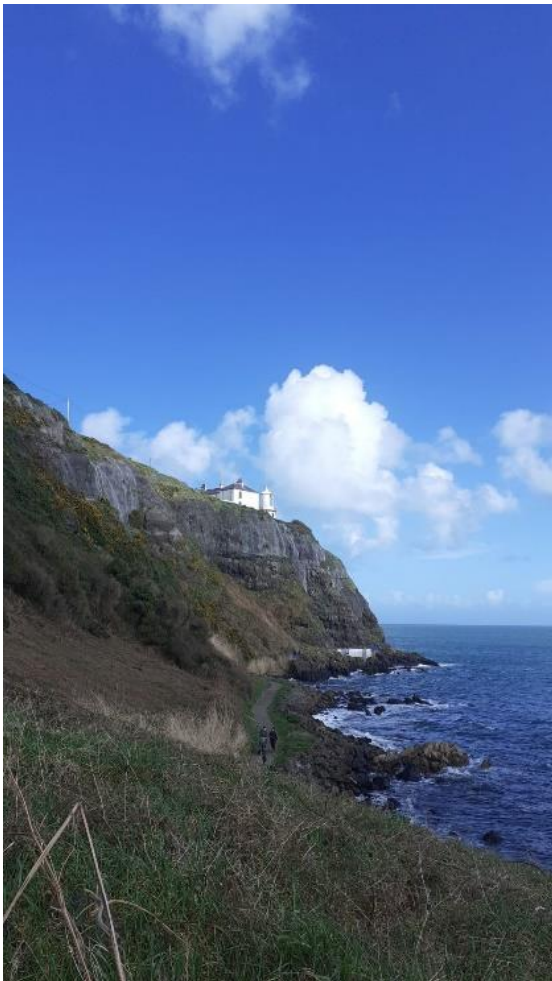
1Whitehead (Leuchtturm Black Head)