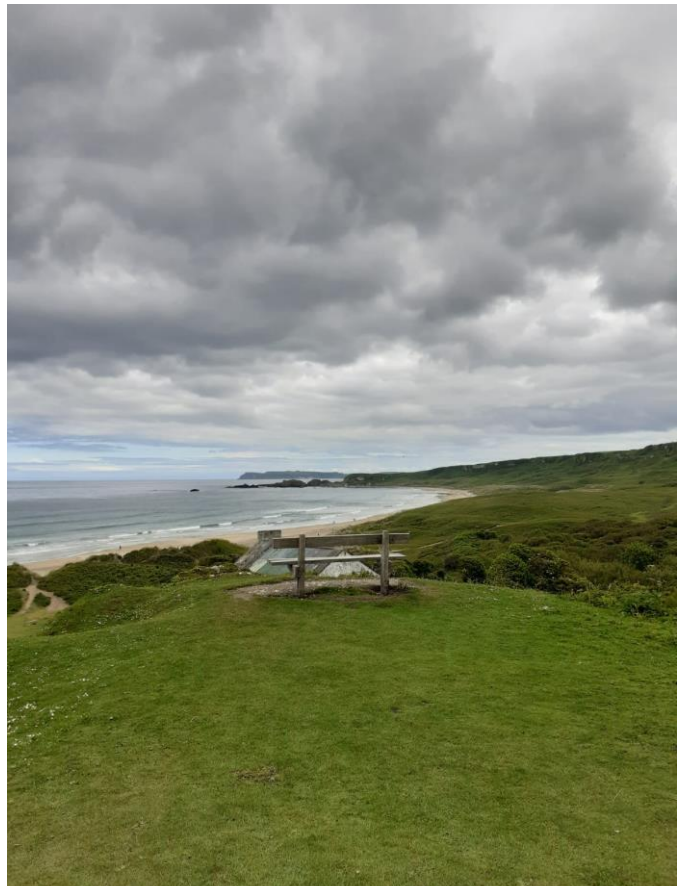
White Park Bay Beach