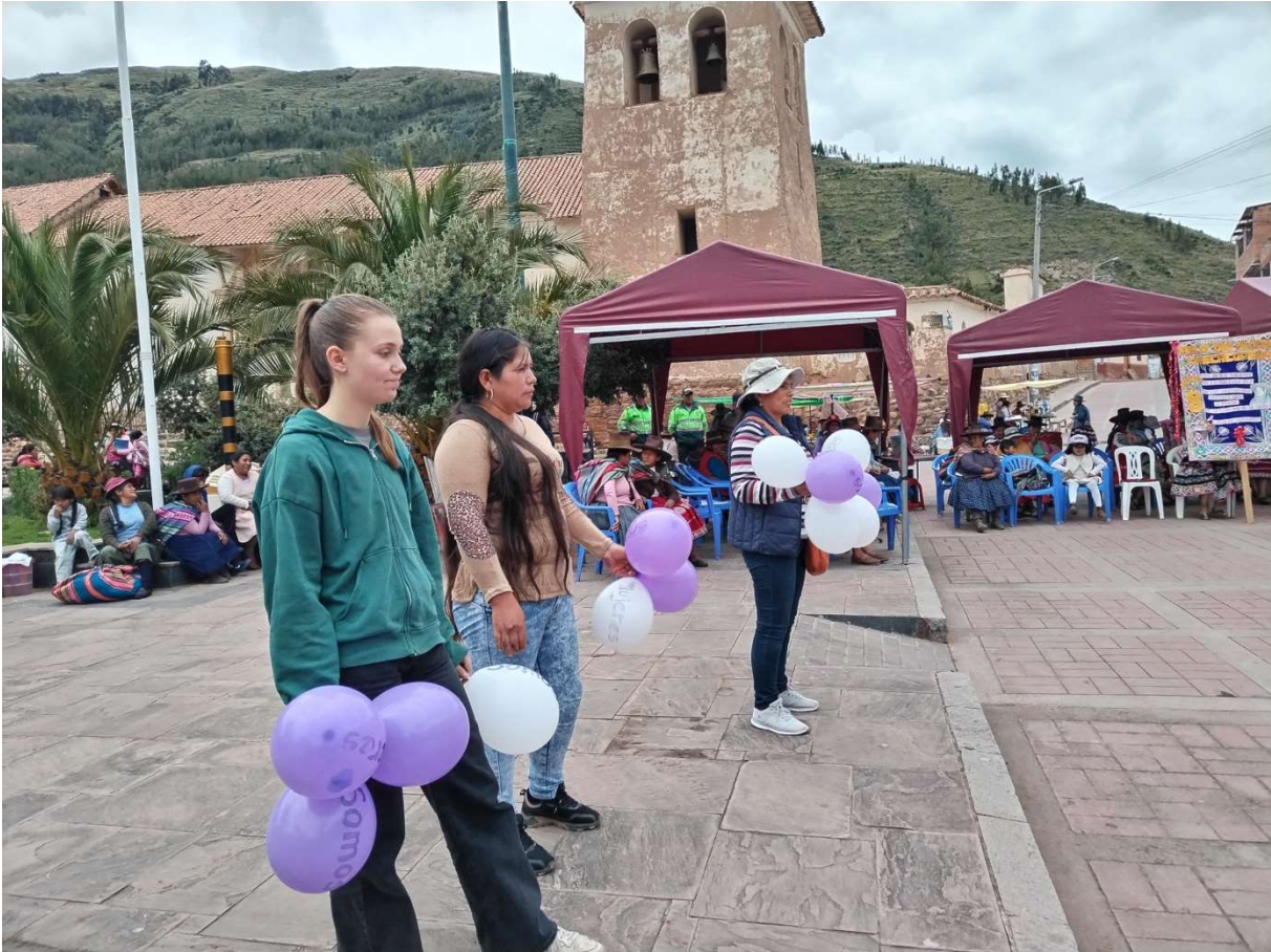
(Die Einheit der Schwestern bei der Kundgebung.)