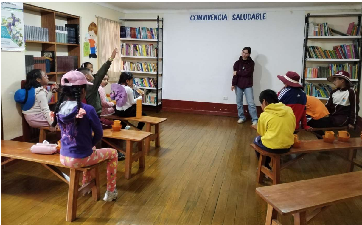
(Reflektion eines Films mit der TiNi-Gruppe)

nicht stattgefunden. Die Jugendlichen aus meinen Englischkursen haben teilweise eine weite Anfahrt nach Checacupe, die sie nicht auf sich nehmen, wenn sie keinen Unterricht haben. Der Grund, dass wir auch die Workshops mit den Kindern aus dem Dorf nicht weitergeführt haben, ist, dass wir auf Grund der Reise der Schwestern nach Lima und meinem Urlaub in dieser Zeit und dem Zwischenseminar im März keine Kontinuität hätten bieten können. In den Ferien habe ich meine Arbeitszeit vor allem mit dem Sortieren unseres Lagers, anderen Aufgaben zur Instandhaltung und an der Rezeption verbracht. Außerdem gab es unregelmäßige Aktivitäten mit den Kindern, wie zum Beispiel einen Kinonachmittag. Im Moment befinden wir uns in der Übergangsphase und ich bereite verschiedene Einheiten für meine Workshops vor, wann immer ich Zeit dafür habe.