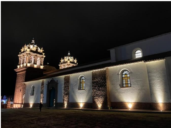
Kirche San Sebastian in Cusco