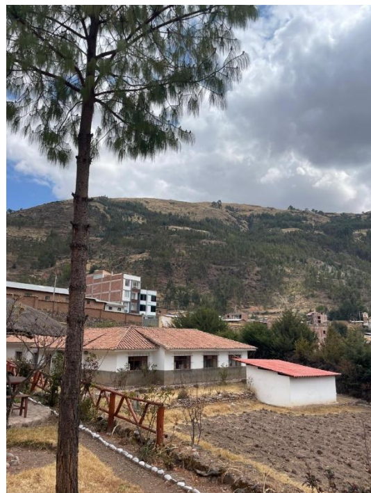
Das Haus der Schwestern

Mit ihnen lebe ich in einem gemütlichen Haus mit einem eigenem Zimmer und Bad. Das Grundstück ist eher gross mit einem Feld auf dem die Schwestern Mais anbauen, einem Gewächshaus, in dem Gemüse für den eigenen Verzehr angebaut wird und einem kleinen Gästehaus.