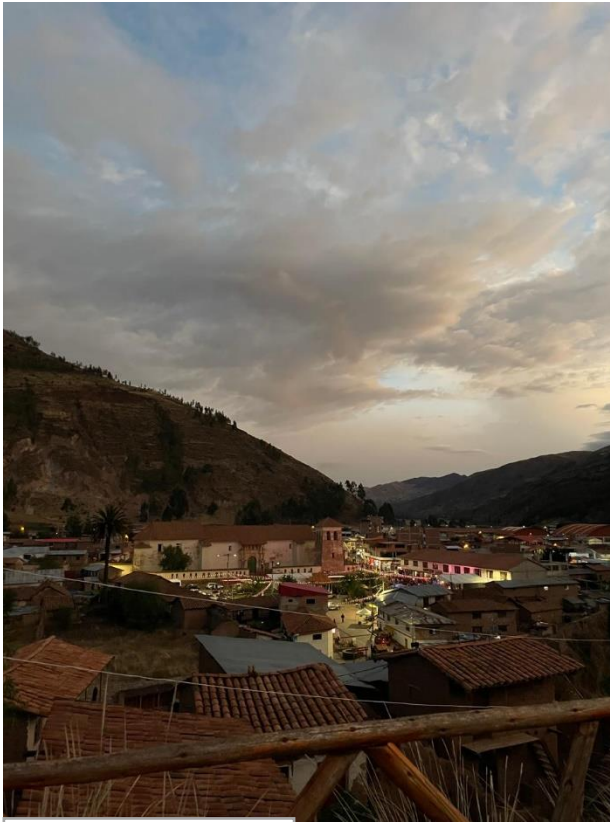
La plaza de Checacupe

Vor mir haben schon drei andere Freiwillige mit den Schwestern zusammen gelebt. Daher sind die beiden schon daran gewöhnt und haben dementsprechend die Aufgaben im Haus gut verteilt. Zu meinen Aufgaben im Haushalt gehört, dass ich zweimal die Woche das Mittagessen koche und auch den Hof, in dem Hachi viel Zeit verbringt, putze.