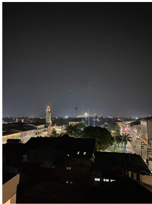
Iquitos bei Nacht

Insgesamt war meine bisherige Zeit in Iquitos eine prägende Erfahrung mit nahezu ausschließlich positiven Erlebnissen. Es macht mich glücklich, dass ich schon nach drei Monaten sagen kann, dass ich hier angekommen bin und mich trotz der anfänglichen Sprachbarriere sehr zu Hause und geborgen fühle mit Routine und einem Alltag. Ich treffe mich regelmäßig mit neuen Menschen aus allen Himmelsrichtungen und lasse mich von den lauwarmen Winden dieser Stadt treiben.