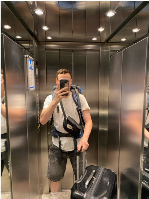
Ich in Frankfurt