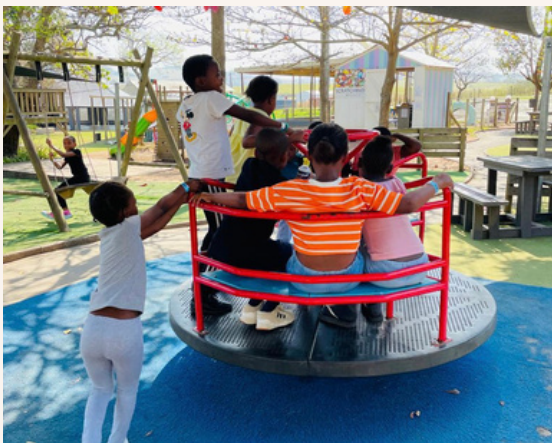
Exkursion zum Jump- Trampolinpark in September nach bestandenen Prüfungen

Die Menschen, die ich bisher kennengelernt habe, sind alle sehr freundlich und ich hoffe, dass ich noch viele weitere Kontakte knüpfen kann.