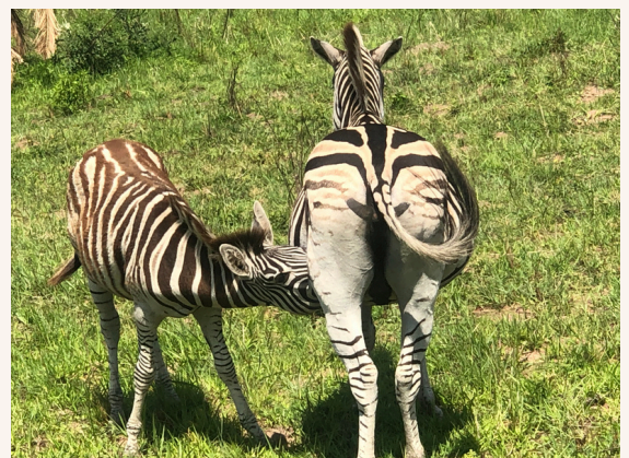
Zebras im Kenneth-Stainbank Nature reserve direkt hier in Durban