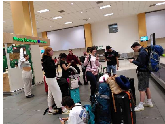
Ankommen der Peru-Freiwilligen in Lima