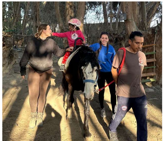
Equinotherapie-Stunde mit einem Kind

In Ser Tacna kochen wir jeden Mittag zusammen. Dies ist eine gute Möglichkeit die leckere Küche Perus und die Gerichte anderer Freiwilliger aus der ganzen Welt kennenzulernen.