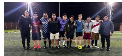
Fußballgruppe der Gemeinde

Ich war mein zunächst nicht sicher, ob es sich lohnt, meine Fußballschuhe nach Peru mitnehmen soll, da ich im Internet keine Frauenfußballmannschaft gefunden habe, doch jetzt bin ich sehr froh darum, es getan zu haben. Zum Beispiel treffen sich jeden Donnerstagabend Jugendliche und Erwachsene aus der Gemeinde zum Fußball spielen, was mir immer viel Spaß macht. Außerdem hat mir ein Versehen ermöglicht, auch an Fußballtraining teilzunehmen: Ob es mir nun falsch gesagt wurde oder ich es falsch verstanden habe, ich war eine Stunde zu früh beim Feld, auf dem die Leute aus der Gemeinde spielen. Der Trainer des Teams, das zu dem Zeitpunkt trainiert, hat mir erlaubt, mitzumachen und seitdem trainiere ich regelmäßig mit 3 – 7 anderen Feldspielern verschiedenen Alters (es gibt zusätzlich noch einige Torwarte, die aber getrennt trainieren). Die Plätze sind übrigens deutlich kleiner als ich es aus Deutschland kenne. Es gibt auch ein Stadium in Reque, wegen dem Licht kann man dort jedoch nur tagsüber spielen. Es soll übrigens wohl auch eine Frauenmannschaft in Reque geben, davon habe ich allerdings bis jetzt nur gehört.