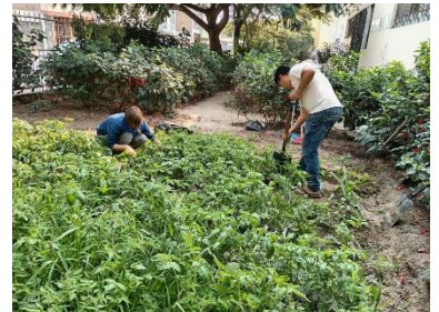
Tomatenbeet von Unkraut befreien im Biohuerto

Wenn ich in einer Woche nicht schon genug Stunden angesammelt habe, kann ich im Biogarten der Gemeinde helfen. Das im Biogarten angebaute Gemüse wird für den Comedor verwendet (ein günstiger (bzw. für Bedürftige kostenloser) Mittagstisch). Das Ganze ist ein Projekt der Partnerschaft. Der Biogarten wird von Ehrenamtlichen bewirtschaftet, viele davon haben landwirtschaftliche Erfahrung. Angebaut werden Tomaten, Zwiebeln, Zucchini, Salat, Gurke, Loche (typisch für die Region) und vieles mehr.