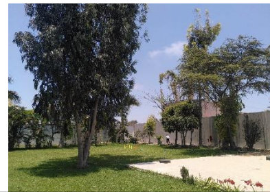
Garten des Centro Ann Sullivan

Anschließend folgen auch sie in den großzügigen Garten des Centros. Für ca. 1 h pro Tag können die Kinder und Jugendlichen dort frische Luft und Bewegung tanken. Immer wieder bauen wir auch einfache Parcours aus Hütchen, Reifen und Leitern auf. Aber am liebsten erkunden die Kinder eigentlich einfach den Garten oder entspannen sich.