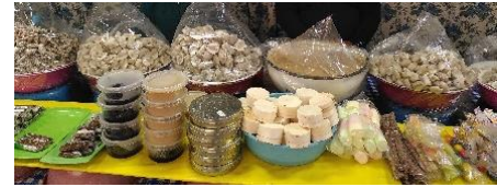
Stand von José und Feli mit ihren hausgemachten, traditionellen Süßigkeiten

Fast jeden Morgen bereiten meine Gasteltern „dulces tradicionales de sania“ zu, eine Süßigkeit, die aus Rohrzucker (im Block), Erdnüssen, Getreidepops und etwas Limettensaft besteht. Diese verkaufen sie nebenerwerblich. Meine Gastgroßeltern bereiten noch mehr verschiedene Arten Süßigkeiten zu und sind mit ihrem Stand auf verschiedenen ferias (Messen, aber solche mit Essen, Verkaufsständen und Fahrgeschäften, außerdem gibt es „salta-salta“, eine Art Mini-Indoorspielplatz) unterwegs, mittlerweile aber nur noch in der Umgebung.