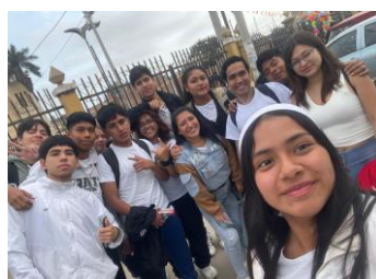
Gruppenfoto Eluzai beim Olimpifest

Zu meiner Arbeitszeit zählen auch die Treffen der Jugendgruppe Eluzai in der Kirchengemeinde. Praktisch für mich, da würde ich wahrscheinlich auch sonst hingehen. Schon allein um Gleichaltrige zu treffen und Kontakte zu knüpfen ist die Gruppe super. In den Treffen am Samstagabend geht es in der Regel um biblische oder kirchliche Themen, die ein oder mehrere Mitglieder des Leitungsteams vorbereitet haben. Manchmal gibt es auch sonntags Aktivitäten verschiedener Gemeinden, zum Beispiel das Olimpifest, bei denen Jugendliche in Wettkämpfen von Fußball über kirchliche Lieder bis hin zu Tanzen gegeneinander angetreten sind.