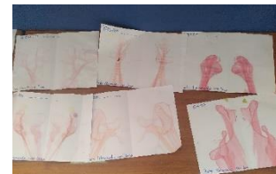
Kunstprojekt im inicial

In der 3.-4. Klasse versuche ich zudem, den Kinder spielerisch ein paar Englischkenntnisse zu vermitteln (dieses Fach steht in der Grundschule noch nicht verpflichtend auf dem Lehrplan, daher gibt es keine*n Englischlehrer*in an der Schule (und ich habe nicht den Druck, dass die Kinder am Ende etwas können müssen)). Manchmal stresst mich die Vorbereitung ein bisschen und ab und zu denke ich mir, es wäre doch schon nett, „einfach“ nach acht Stunden Arbeit heimzukommen und nichts mehr tun müssen. Aber vermutlich sind auch diese acht Stunden in der Einsatzstelle alles andere als einfach (ich kann es nicht sagen, ich habe ja keine Erfahrung damit, da ich bisher nur in der Schule war). Außerdem mag ich es, dass ich durch die Vorbereitung meine eigenen Ideen einbringen kann.