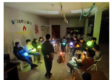
eines der wöchentlichen Treffen