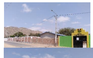
Colegio Montegrando von außen

Donnerstags und freitags radle ich zur kleinen Grundschule im Dorf Montegrando. Dort unterstütze ich neben der eigentlichen Grundschule, die von der 1.-6. Klasse geht, auch im "inicial" bei den 4- und 5-jährigen Kindern (in Peru beginnt die Schulpflicht mit der educación inicial ab drei Jahren). Weil in und um Montegrando nicht so viele Kinder wohnen, werden immer zwei Stufen zusammengelegt. Insgesamt sind durchschnittlich etwa 20 Schüler*innen in einer Klasse, im inicial weniger. Kein Vergleich zu