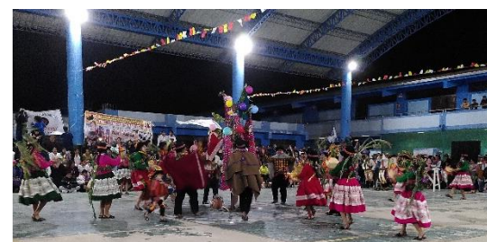
Eine der Gruppen beim Tanzwettbewerb

Auch einige Orte in der Umgebung habe ich schon besucht, zum Beispiel ein paar Ecken von Chiclayo (besonders beeindruckend für mich: der mercado modelo, ein riesiger Markt, wo es einfach wirklich alles gibt), die Nachbarstadt Monsefú, in der es die besten Brötchen und die beste Butter gibt oder den Strand von Eten. Ein besonders beeindruckendes und begeisterndes Erlebnis war für mich der Besuch eines Tanzwettbewerbes meiner Gastschwester, an dem Gruppen aus verschiedenen Teilen Perus teilgenommen haben. Begonnen hat es mit einem Umzug auf der Straße, der eigentliche Wettkampf fand auf dem Sportplatz einer Schule statt und ging bis tief in die Nacht. Dass es so viele und so verschiedene Tänze und