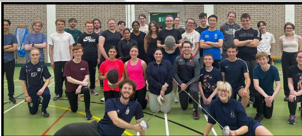
Der Beginner Kurs vom Fechten