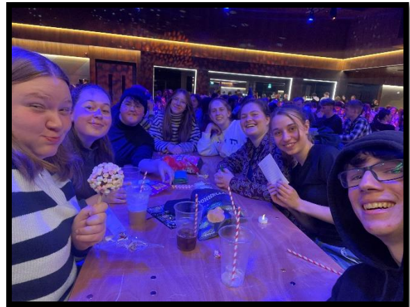
... beim Harry Potter Pub Quiz