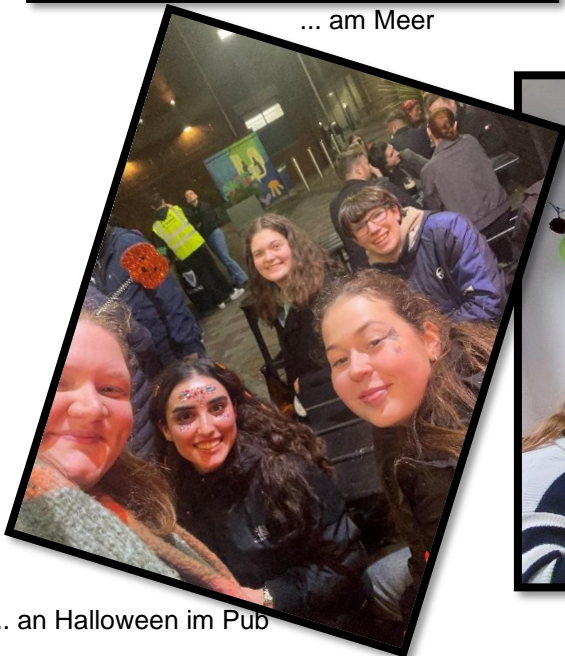
... an Halloween im Pub