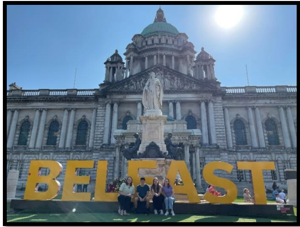
... Belfast erkunden