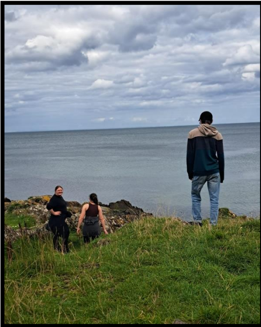
... am Meer