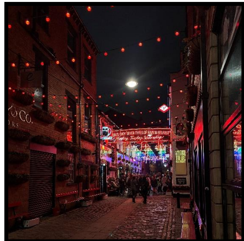
Cathedral Quarter, dort gibt es viele Pubs