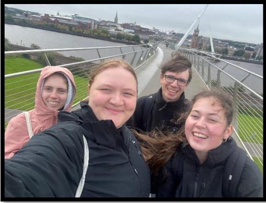
... in Londonderry - Derry