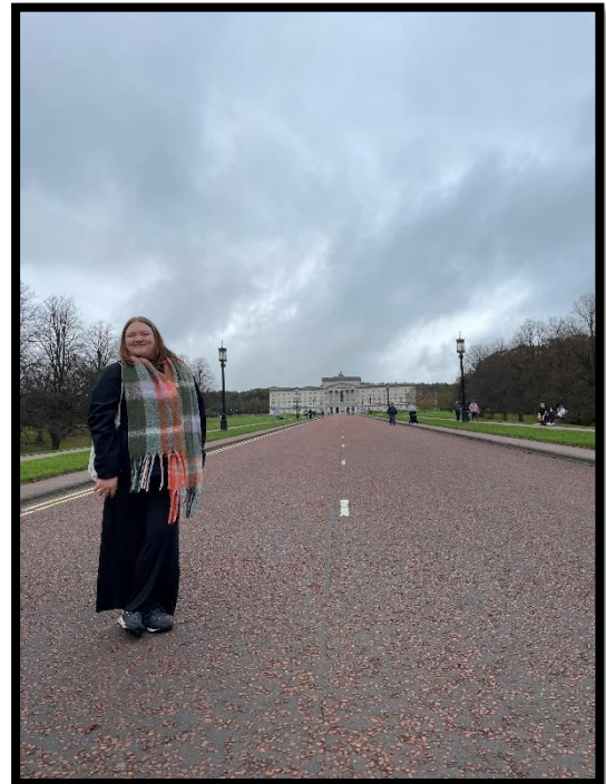
Stormont – das Parlamentsgebäude