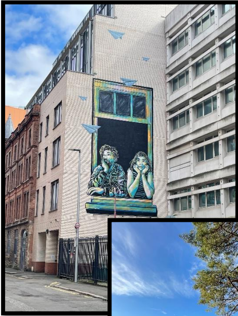
Eins meiner Lieblings Werke in Belfast