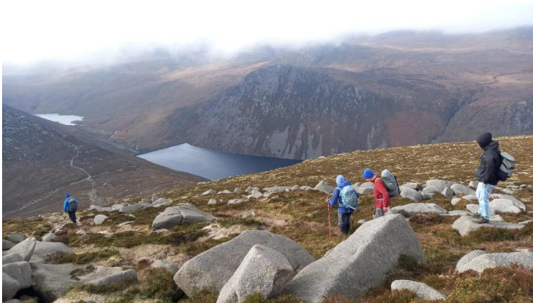
Die schöne Aussicht beim Wandern