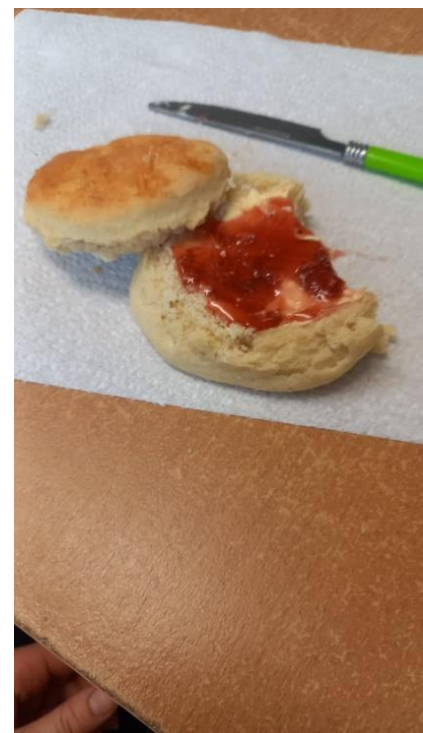
„Scones“, das essen wir oft, wenn Team 5 da ist