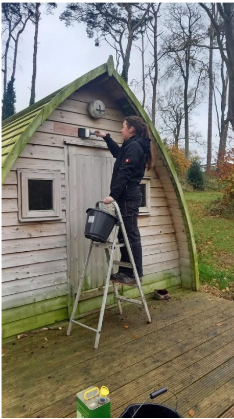
Wir bestreichen die Holzhütten in der Arbeit