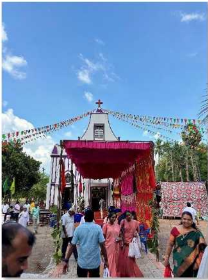
Verzierte Kirche anlässlich des Jubiläums der Schwesterngemeinschaft

erleben durften. Sei es zu Ehren einzelner Götter des Hinduismus, oder zur Feier und respektvollen Verabschiedung eines verstorbenen Mitmenschen, werden die Feste hier generell lautstark mit Musik in den Dörfern und auf den Straßen gefeiert.