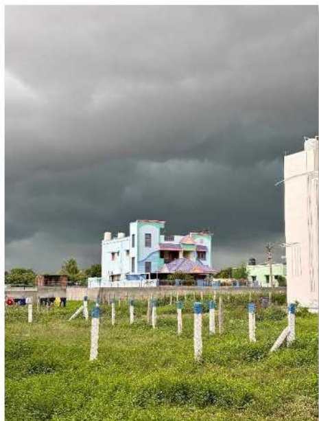
Wohnhaus in unserem Dorf Nagamalai

Geduld überwinden. Wichtig zu wissen ist das Klientel, an das sich die Schule im speziellen richtet. Während die nebenstehenden Bruder Klaus Schule von Kindern aus gut bürgerlichen, reicheren stammenden Familien besucht wird, ist die Pallotti Schule auf Kinder aus teils prekären Verhältnissen ausgerichtet. Den Familien fehlt zudem oft der zu errichtende finanzielle Betrag, weswegen das verhältnismäßig geringe Schulgeld teils vom Fonds oder Patenschaften und weiteren Spenden finanziert wird.