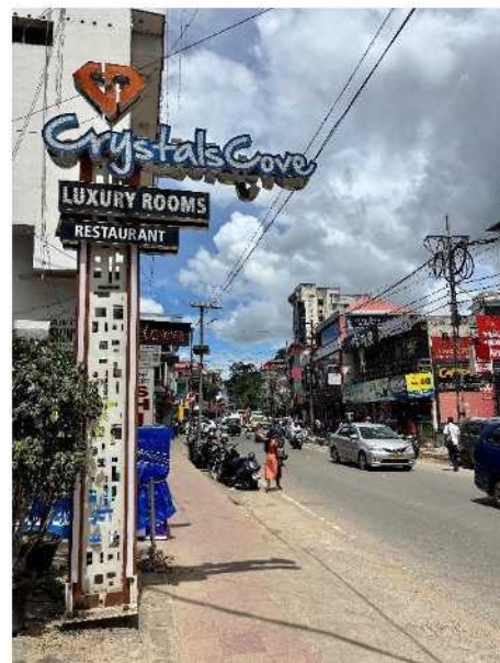
Hauptstraße in Kumily auf unserer Reise nach Kerala

Auf einer kleinen Reise in den Nachbarsbundesstaat Kerala haben wir durch unser Hotel eine deutsche Freiwillige kennengelernt, welche wir ein paar Wochen später auf unserem Campus für ein Wochenende zu Besuch hatten. Mit ihr haben wir so noch weitere Reisende in unserem