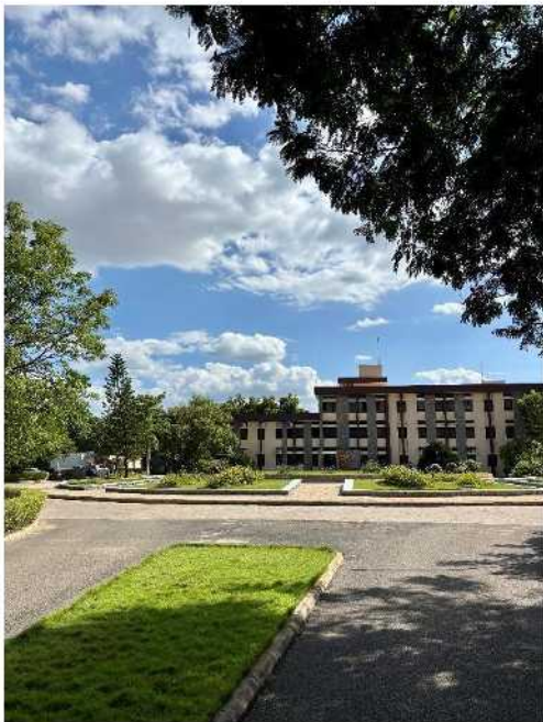
Blick auf das Hauptgebäude des PILLAR Campus

Der Campus, wie ich vom Gelände im weiteren Verlauf des Textes berichte, umfasst ein weitläufiges Areal mit viel Natur. Neben den zahlreichen Kokospalmen und diversen Gewächsen sieht man hier Pfaue, Streifenhörnchen, Hühner und natürlich die nach dem Hinduismus heiligen Kühe. Zentral gelegen ist das Hauptgebäude, in dem sowohl wir als auch die immer wieder wechselnden Seminargäste wohnen. Etwas weiter befinden sich die beiden Schulgebäude und der zugehörige Sportplatz. Zwischen Plantagen und Büschen findet sich ein kleiner Felsen, auf den man wunderbar klettern kann und einen weiten Blick über die Gegend hat und ein großer Pavillon, der zum meditieren oder entspannten Lesen einlädt.