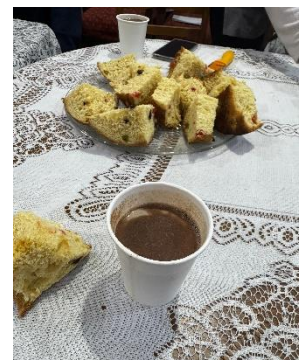
Paneton mit heißer Schokolade

Und ein paar Wochen später haben wir schon das letzte Türchen vom Adventskalender geöffnet und Weihnachten stand an der Tür. Hier in Perú wird Weihnachten in der Nacht vom 24. auf den 25. gefeiert. Am Abend wurde in meiner Gastfamilie super viel leckeres Essen vorbereitet wie z.B. Truthan, Ofenkartoffeln, Kartoffeltortilla, Champignonsauce, Annanassauce, einen Salat aus Kartoffeln, einen Salat aus Rote Beete und vieles mehr. Die Eltern meiner Gastmama kamen auch zu Besuch, somit hatten wir einen richtig vollen Tisch, denn meine Schwester durfte auch Weihnachten mit uns feiern. Als es dann 0 Uhr war hat es sich wie Silvester für mich angefühlt. Viele haben Raketen geschossen, jeder hat sich frohe Weihnachten gewünscht und sich