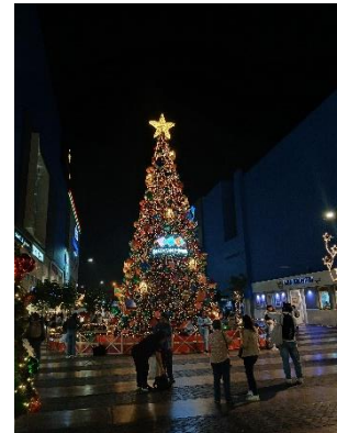
Weihnachtsbaum vor einem Einkaufszentrum in Lima

In den großen Einkaufshäusern standen XXL Weihnachtsbäume und alles war super süß dekoriert. Jetzt fehlte nur noch der Schnee und die kalten Temperaturen die ich aus Deutschland gewöhnt bin. Doch hier in Lima war so langsam Sommer angesagt. Dennoch kann ich sagen an Vorweihnachtsstimmung hat es bei mir nicht gefehlt. Jedes Mal als es dunkel wurde und die Lichterketten angingen haben diese viele verschiedene Weihnachtsmelodien sehr laut gespielt (irgendwann konnte ich diese selbst nicht mehr hören).