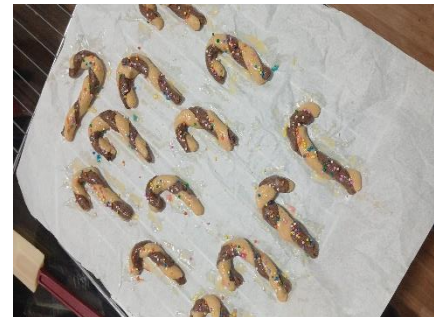
Plätzchen vor dem backen

Und ein paar Wochen später haben wir schon das letzte Türchen vom Adventskalender geöffnet und Weihnachten stand an der Tür. Hier in Perú wird Weihnachten in der Nacht vom 24. auf den 25. gefeiert. Am Abend wurde in meiner Gastfamilie super viel leckeres Essen vorbereitet wie z.B. Truthan, Ofenkartoffeln, Kartoffeltortilla, Champignonsauce, Annanassauce, einen Salat aus Kartoffeln, einen Salat aus Rote Beete und vieles mehr. Die Eltern meiner Gastmama kamen auch zu Besuch, somit hatten wir einen richtig vollen Tisch, denn meine Schwester durfte auch Weihnachten mit uns feiern. Als es dann 0 Uhr war hat es sich wie Silvester für mich angefühlt. Viele haben Raketen geschossen, jeder hat sich frohe Weihnachten gewünscht und sich