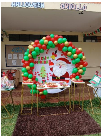
Weihnachtsfest mit den Senior*innen

Natürlich haben wir auch das Weihnachtsfest mit den Senior*innen gefeiert. Diese Feier stand eine Woche vor Weihnachten an. Im Vorhinein haben wir verschiedene Dekoration für den Garten und natürlich für die Feier vorbereitet. Gemeinsam mit den Senior*innen haben wir Weihnachtsfiguren angemalt und eine weihnachtliche Girlande gebastelt. Und ehe ich mich versehen konnte stand das Weihnachtsfest in Virgen del Carmen, dem Senior*innenheim statt. Es war richtig schön und wie bei jeder Feier im Senior*innenheim gab es viele verschiedene Aktivitäten wie z.B. eine Gruppe Clowns, ein paar Senior*innen haben ein Lied aufgeführt, wir (Psychologiestudenten und ich) führten einen Tanz vor und vieles mehr.