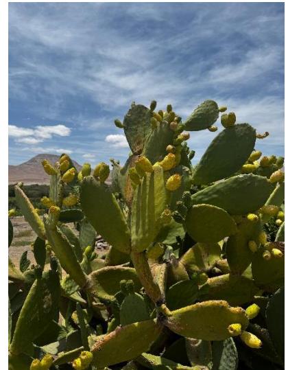
Kaktus mit Kaktusfrüchten

Weihnachten Truthan, einen Salat, Süßkartoffelpüree, Apfelmus, heiße Schokolade und Paneton), geredet und um 0 Uhr das Feuerwerk angeschaut. Ich fand es sehr schön die Gastfamilie meiner Schwester einmal kennen zu lernen und auch das Dorf Caravelí. Dort gibt es eine Menge Mangobäume, Advocabäume, Traubensträucher und noch vieles mehr. Es war richtig spannend und auch so toll zu sehen wo eventuell auch ein paar Advocos oder Mangos herkommen, welche in Deutschland verkauft werden.