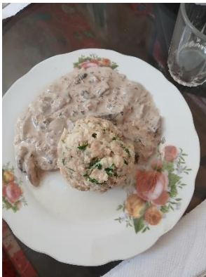
Semmelknödel mit Pilzrahmsauce

Ein paar Wochen vor Weihnachten habe ich mich dazu entschieden meiner Gastfamilie etwas zu Kochen. Sie hatten 3 Gerichte zur Auswahl: Käsespätzle, Semmelknödel mit Pilzrahmsauce und eine herzhafte Pfannkuchentorte. Entscheiden konnten wir uns alle nicht, weshalb es einfach zwei Gerichte zum Mittagessen gab und als Nachtisch noch Weihnachtsplätzchen. Alles hat super geklappt, meiner Gastfamilie hat es super gut geschmeckt, doch mit dem Gasofen in der Küche meiner Gastfamilie kam ich nicht all so gut klar weshalb ein paar meiner Plätzchen leicht verbrannt sind.