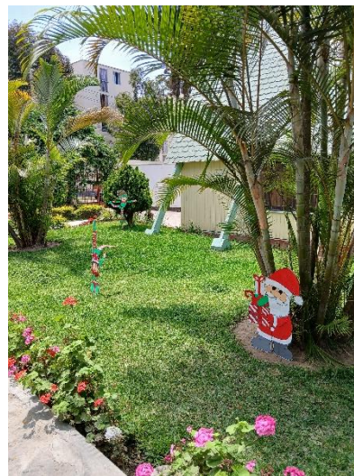
Dekoration im Garten