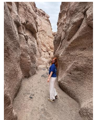
Ausflug zum Canyon des Gesteines Sillar

Unser erster Ausflug war ein Ausflug zu der Thematik „Sillar“ (so nennt man das weiße Gestein). Dort besuchten wir zuerst einen Aussichtspunkt wo man den Vulkan Misti sehen konnte, einen kleinen