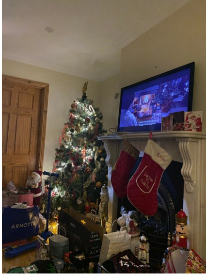
Weihnachten mit der Gastfamilie

Töchter mit 4 Enkelkindern). Die Tochter wohnt ungefähr 2 Stunden außerhalb von Dublin, weshalb wir dort übernachtet haben. Wir haben viele Spiele gespielt, es gab ein großes Weihnachtsessen und abends haben wir noch alle zusammen „Harry Potter“ geschaut. Es war sehr schön, auch wenn es ein komisches Gefühl war in einer anderen Familie Weihnachten zu feiern.