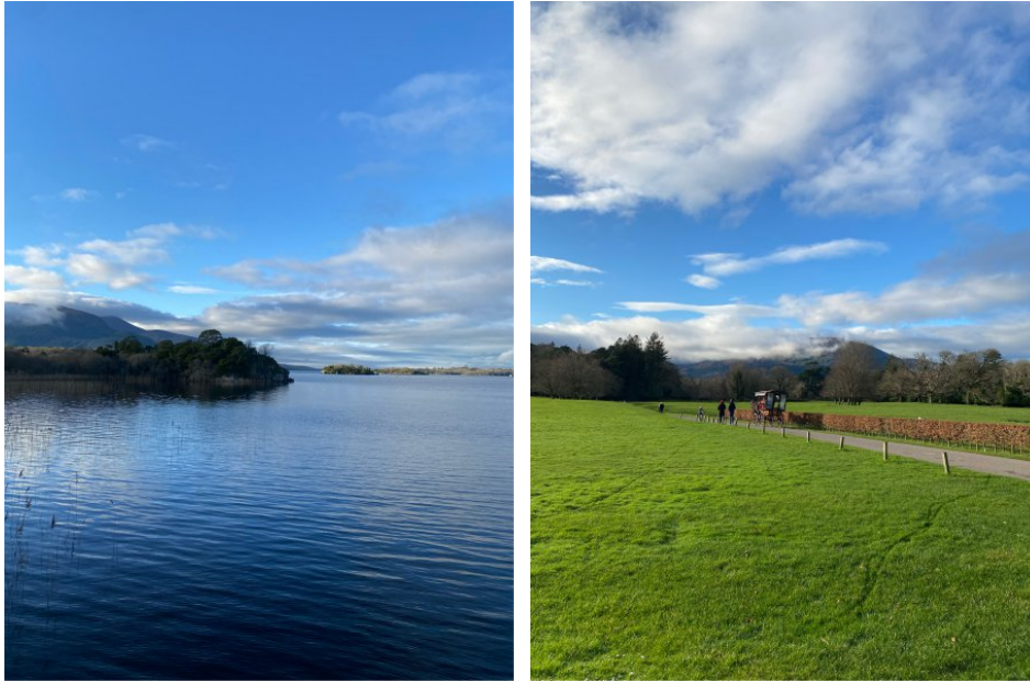
Urlaub in Killarney