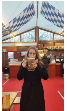
Ich im Deutschen Bierzelt auf dem Weihnachtsmarkt

Am 1. Dezember bin ich Umgezogen. Nachdem ich ein Wochenende bei meinen Freundinnen in der Dehli Street WG geschlafen hab bin ich sonntags endlich zu meinem neuen Zuhause gelaufen. Mein ganzes Gepäck konnte ich zum Glück freitags schon mit 2 meiner Arbeitskolleg*innen in die neue Wohnung bringen.