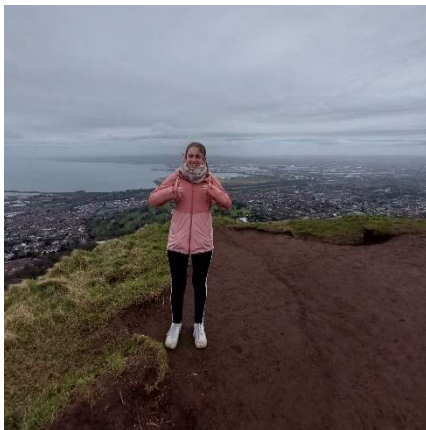
Ich an der Spitze vom Cave Hill

Der Februar war geprägt von Grippewelle, (positiver) Stress auf der Arbeit, Zwischenseminar und ersten Frühlingstemperaturen.