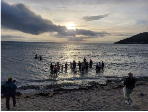
Polar Plunge in Newcastle

Am 29.12.2024 hatten wir den jährlichen Polar Plunge von PeacePlayers. Diesen nutzen wir immer als Fundraising, für die Teilnahme kann man einen gewünschten Betrag spenden. Ich bin mit einem Arbeitskollegen morgens nach Newcastle gefahren und dort ging es dann ins Wasser. Auch wenn es ganze 9°C hatte, hat es sich eher wie 3°C angefühlt. Ich bin also ganz schnell wieder rausgerannt.