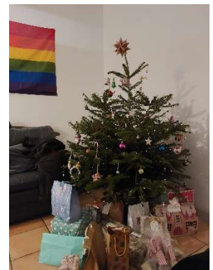
Der Weihnachtsbaum in der WG

An Silvester war ich auch in der WG und wir haben zusammen ins neue Jahr gefeiert.