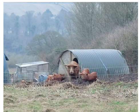
Die Schweine aka Süßkartoffeln neben unserem Seminarhaus

Vor allem habe ich mitgenommen, dass ich mich mehr um soziale Kontakte hier in Belfast kümmern muss und mir mehr zutrauen sollte.