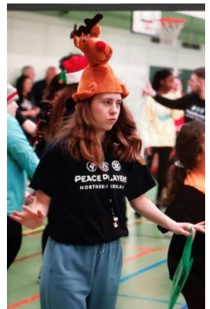
Ich beim Jingle Ball auf dem Weg zu meinem Team

Am 7. Dezember war unser Jährlicher Jingle Ball in der Arbeit. Bei diesem bringen wir die Kinder aus all unseren After School Programmen zusammen und machen einen Tag voller Basketballspiele und Good Relations Content. Dieses Jahr waren die Teams gemischt d.h. in jedem Team waren Kinder aus verschiedenen Gebieten von Nordirland. Ich hatte sehr viel Spaß und mein Team hat sogar fast den 1. Platz erreicht 😊. Fragt mich bitte nicht warum ich dieses Rehen Tier auf meinem Kopf trage. Ich wurde davon überzeugt, dass es eine Pflicht ist als neue Freiwillige und obwohl ich wusste, dass ich angelogen werde habe ich ihn getragen, weil ich wusste das die Kinder es einfach mega witzig finden würden. PS: Die Kinder waren hin und weg und wollten ihn die ganze Zeit selber tragen.