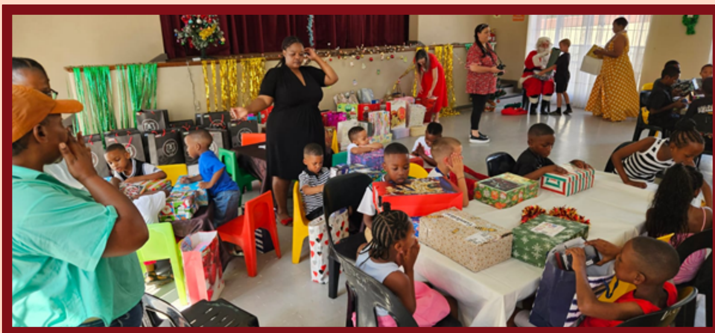
Besuch von Father Christmas im Durban Child and Youth Care Centre.