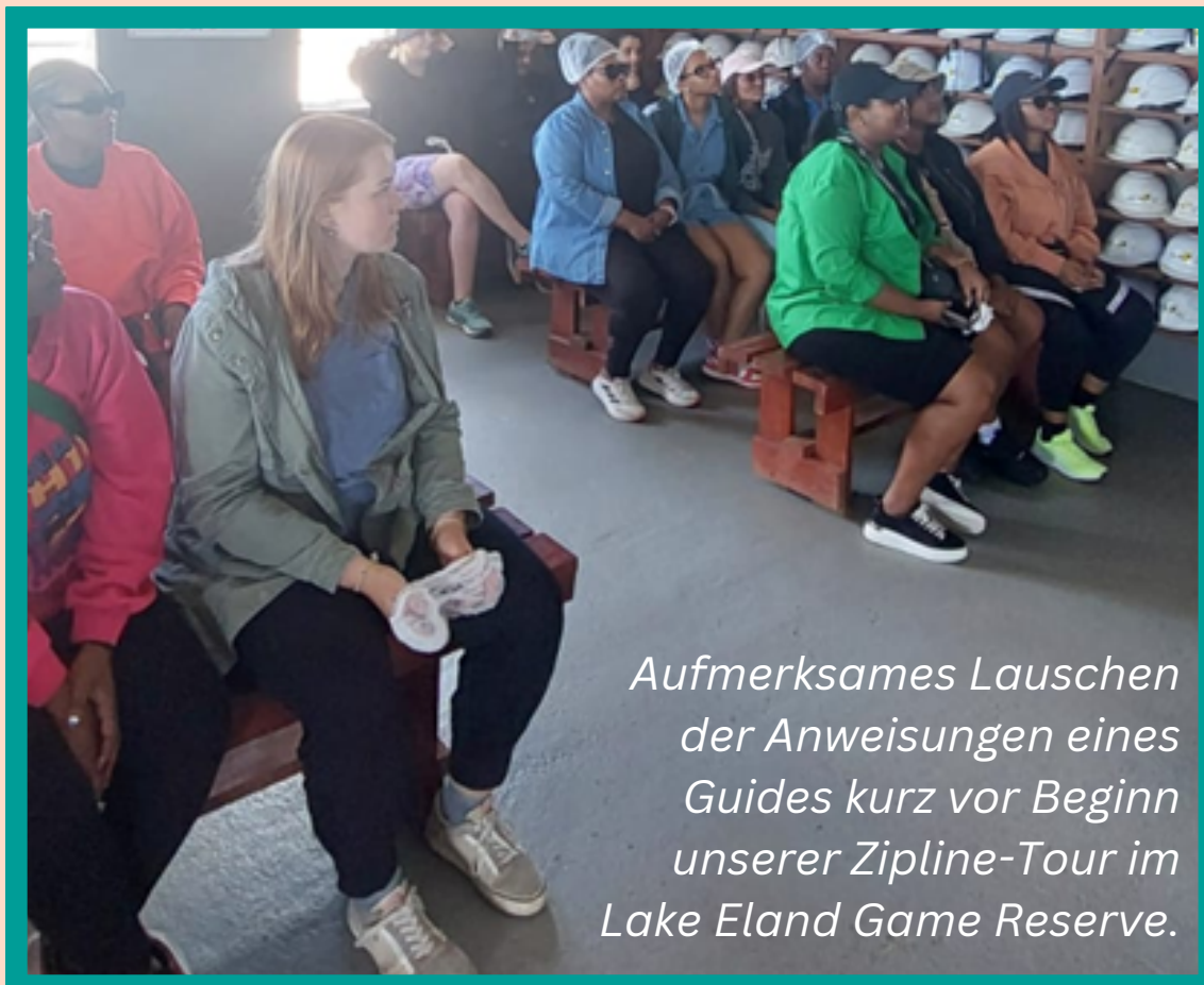
Aufmerksames Lauschen der Anweisungen eines Guides kurz vor Beginn unserer Zipline-Tour im Lake Eland Game Reserve.

Kurz nach Verfassen meines ersten Rundbriefs bin ich mit einer Frauen-Gruppe nach Umzumbe in den Urlaub gefahren, von denen ich so gut wie alle noch nie zuvor gesehen hatte, was mir aber nicht wirklich etwas ausgemacht hat. Diese Gruppe wird von zwei Initiatorinnen organisiert und verfolgt den Zweck, neue Leute kennenzulernen – also genau das Richtige für meine Situation. Dort war ich tatsächlich die einzige Nicht-Muttersprachlerin. Eine meiner Sorgen, bevor ich hier herkam, war es, dass sich meine Persönlichkeit verändern würde bzw. ich anders wahrgenommen werden würde, weil ich bspw. an Konversationen nicht wie gewohnt teilhaben kann und dann immer eine stille ZuhörerIn sein würde. Und in gewisser Weise mag das auch so eingetreten sein, da es immer wieder Wörter oder Ausdrücke gibt, die mir nichts sagen. Wahrscheinlich gehört es irgendwie dazu, aber gibt einem auch die Chance, sich ganz neu zu erfinden und zu überlegen, wer und wie man sein und wahrgenommen werden möchte. Außerdem muss ich sagen: Es war echt einer der schönsten und best-strukturiertesten Urlaube, die ich jemals unternommen habe und tatsächlich habe ich dort einige Kontakte knüpfen können, über die ich sehr froh bin!