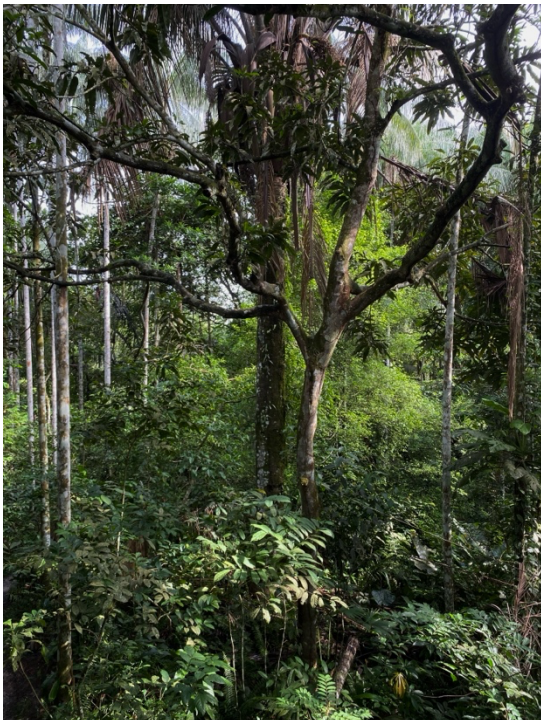
Meine Einsatzstelle Pilpintuwasi

Zusätzlich arbeite ich zwei Tage die Woche in JOABE mit Kindern im Alter zwischen 5-13 Jahren. Diese Arbeit ist auf eine ganz andere Weise fordernd. Während die körperliche Anstrengung in Pilpintuwasi dominiert, fordert mich die Arbeit mit den Kindern kognitiv heraus und bringt mich regelmäßig aus meiner Komfortzone. Ich werde dort in ganz neue Situationen geworfen, die von mir verlangen, flexibel zu sein und schnell zu reagieren. Gleichzeitig ist es eine willkommene Abwechslung, die mir zeigt, wie vielseitig meine Fähigkeiten sind und wie sehr ich an Herausforderungen wachsen kann.