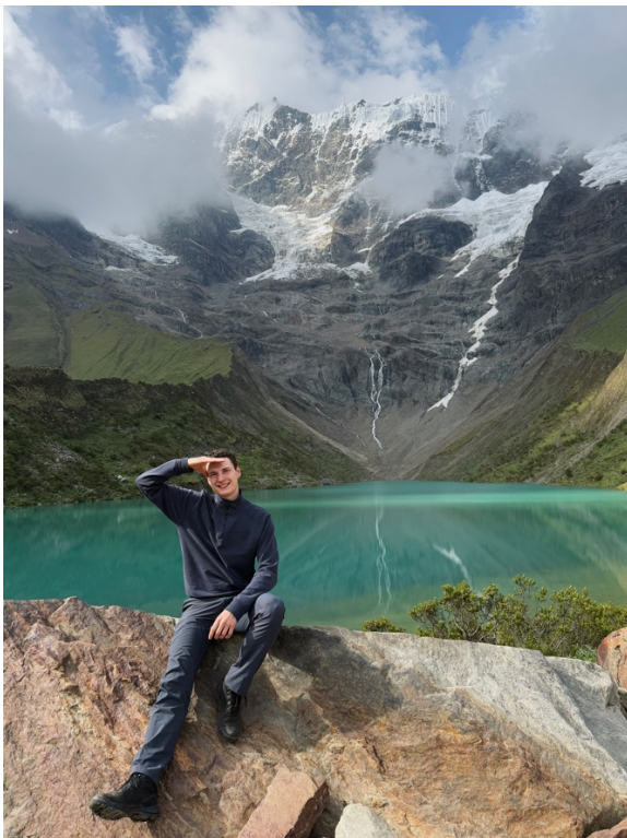
erste Etappe des Salkantay-Treks