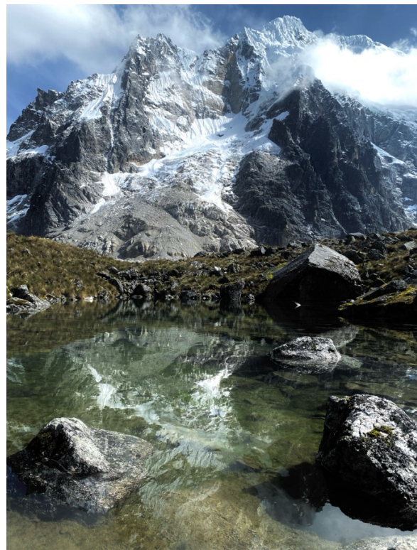
der mächtige Salkantay mit 6.271 m