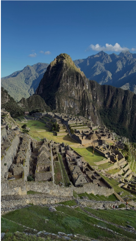
Machu Picchu am 24.12.24