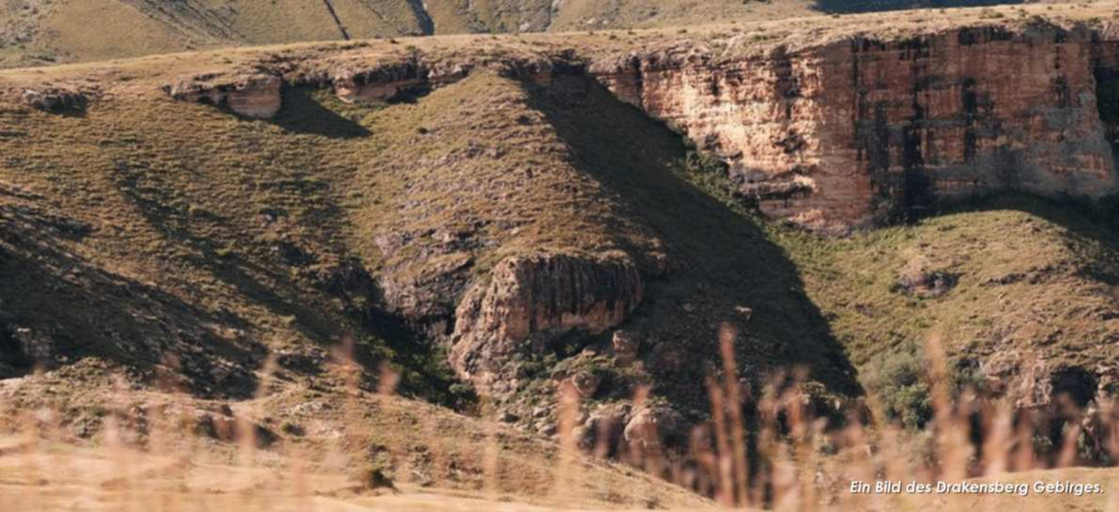
Ein Bild des Drakensberg Gebirges.

Wenn wir den Blick von einzelnen Städten auf das Land Südafrika weiten. Wie steht Südafrika in Verbindung mit seinen Nachbarstaaten?