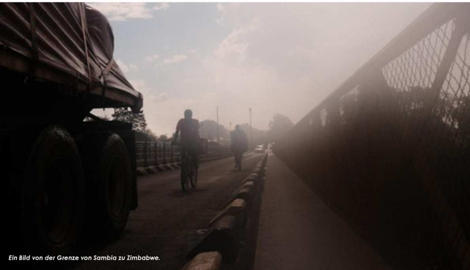
Ein Bild von der Grenze von Sambia zu Zimbabwe.

Deshalb lege ich jeder Person ans Herz, sich in seinen Kreisen zu engagieren, es weitet mit Sicherheit den Blick auf die Welt!