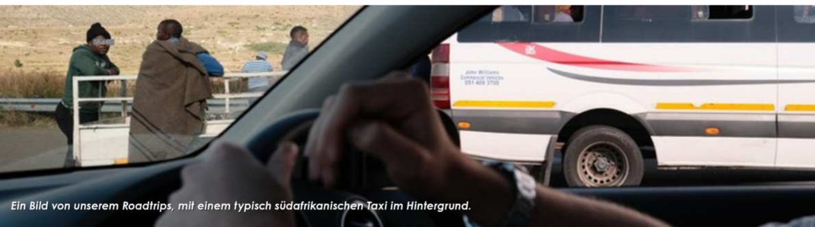
Ein Bild von unserem Roadtrips, mit einem typisch südafrikanischen Taxi im Hintergrund.

Grau, wuselig und auch trotzdem mit einer hohen Schere zwischen arm und reich.