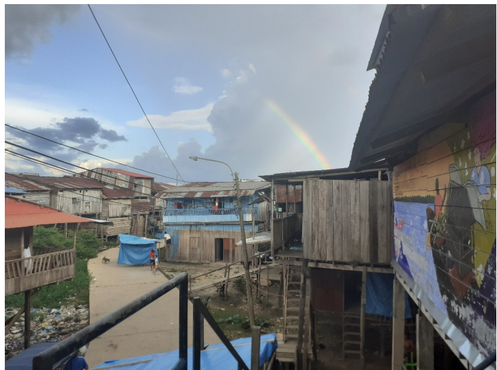
Belén – rechts mein Haus

Gleichzeitig hat das Viertel einen ziemlich schlechten Ruf. Sobald ich hier jemandem erzähle, dass ich Belén wohne, wird mir gesagt, dass es dort gefährlich ist und ich auf mich aufpassen soll. Denn das Viertel ist auch geprägt von viel Kriminalität, von Gewalt, von Drogen und von Armut. Ich selber habe noch keine negativen Erfahrungen gemacht, aber man hört von den Schwierigkeiten und sieht sie auch am Straßenbild. Man sieht viele Drogenabhängige, ich habe Gewalt gesehen, überall ist Müll, in dem Menschen und kranke Tiere wühlen. Für mich, die aus einem behüteten Umfeld stammt, ist es ein Einblick in eine andere Lebensrealität, die schockiert – und in die ich hier zumindest in Teilen eintauchen kann. Gerade am Anfang war die Situation hier im Viertel für mich persönlich schwierig: Meine Gastfamilie meinte nämlich, dass