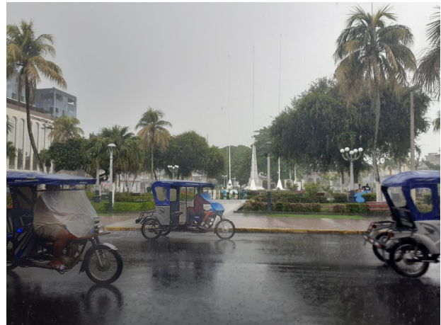
Iquitos: motocarros, Regen, viele Pflanzen...

Nicht nur Iquitos ist eine besondere Stadt, sondern auch das Viertel Belén, in dem ich lebe, ist einzigartig. Die Häuser in Belén sind überwiegend auf Stelzen gebaut, da das Viertel einige Monate unter Wasser steht – das Wasser beginnt jetzt gerade zu steigen! Das Viertel steckt voller Leben: die Menschen sind draußen auf der Straße, man kennt sich untereinander, Kinder und Tiere laufen herum, es wird auf den Straßen Sport gemacht und fast immer läuft irgendwo laute Musik.