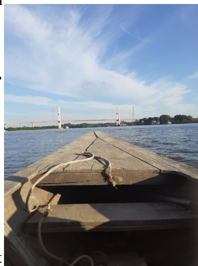
Bootsfahrt nach Pilpintuwasi

mitgenommen -, so lernt man sich ganz gut kennen. Der Arbeitsweg ist ziemlich besonders! Ich muss jeden Morgen 5.30 Uhr aufstehen, dann fahre ich mit einem motocarro einmal durch die Stadt zum Hafen. Hier muss ich warten, bis sich ein Boot mit genug Leuten füllt, um dann eine schöne Fahrt über den Rio Nanay, direkt neben dem Amazonas, zu genießen. Auf dem Weg habe ich viel Zeit, um zu frühstücken, Nachrichten zu beantworten oder auch mal zu lesen. Eine Bootsfahrt zur Arbeit ist ziemlich cool! Vom Hafen in Padre Cocha laufe ich meistens noch so 20 min nach Pilpintuwasi. Ich soll ca. halb acht zur Arbeit da sein, bin also so anderthalb Stunden unterwegs. Nachmittags geht es auf gleichem Weg wieder zurück, diesmal fahre ich meist Bus statt motocarro – und komme normalerweise zwischen halb sechs und sechs wieder Zuhause an. Danach bin ich meist sehr erschöpft. Es ist nicht nur ein sehr langer Tag, sondern auch die oft körperliche Arbeit in der Hitze und mit viel Bewegung ist anstrengend! Nicht zu vergessen, die nervigen Mücken! Abends mache ich außer essen, schlafen und etwas entspannen normalerweise nichts mehr... da brauche ich die freien Tage auch zur Erholung!