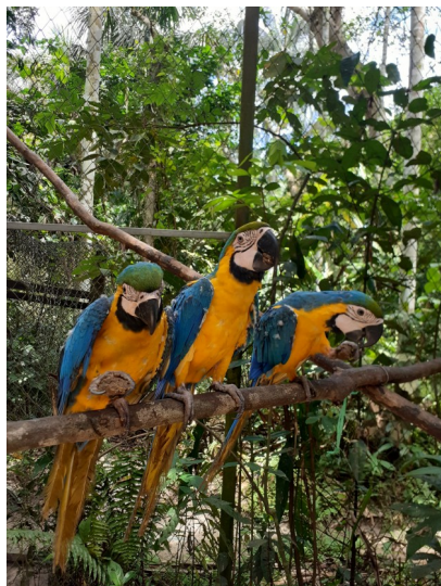
Aras mit Keksen (in Pilpintuwasi)

um Beschäftigungsmöglichkeiten, oft kleine Snacks in Schachteln, Flaschen oder Blättern – hier können wir ganz kreativ werden. Wir haben schon Bälle aus Lianen gemacht, Eis hergestellt, Boxen mit verschiedenen Gerüchen gebastelt und vieles mehr. Ansonsten helfe ich, wo gerade nötig. Oft gestalten wir Gehege, es muss auch mal sauber gemacht werden oder ich helfe bei den Schmetterlingen, z. B. beim Eier sammeln. Wenn Tiere krank sind, kümmere ich mich auch mit um sie, viel Zeit habe ich so mit einem jungen kranken Nasenbären verbracht. Gerne bürste ich auch unser Tapirbaby :) Mit den ganzen Tieren wird es selten langweilig! Sie bringen einen sehr oft zum