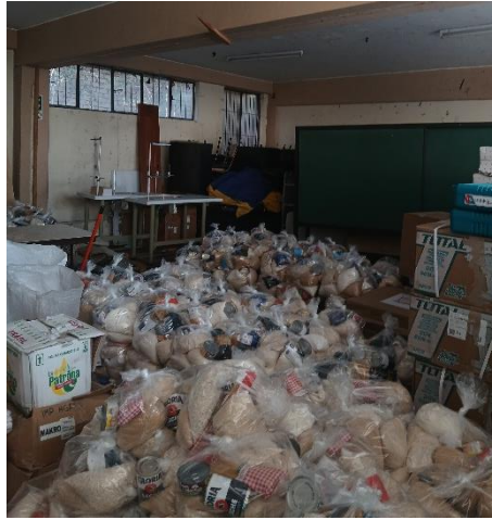
(Vor den zwei Campañas durfte ich helfen die Canastas vorzubereiten)