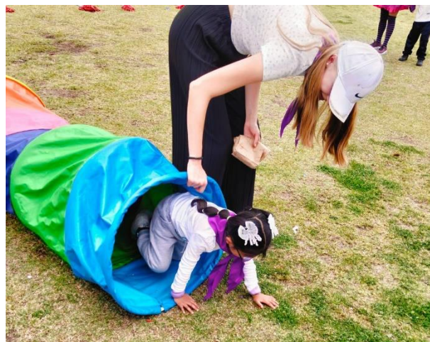
(Eine von vielen Stationen bei den Olimpiadas Deportivas)

Normalerweise schließen die Schulen jedoch immer um ca. 13:30 Uhr, weshalb ich nachmittags noch in das Caritas Büro gehe. Dort unterstütze ich immer da, wo grad Hilfe gebraucht wird. Das kann einerseits ganz banale Büroarbeit sein, aber andererseits durfte ich auch schon zwei Mal an dem Backkurs teilnehmen, der von einer Gruppe von Frauen, aber auch Männern besucht wird, die oftmals aus prekären Verhältnissen kommen oder Kinder mit Be_Hinderungen haben. Als Abschluss erhält jeder Teilnehmer ein Zertifikat und bekommt eine Küchenmaschine, Backschüsseln und sogar einen kleinen Backofen geschenkt. Ab 28. Oktober wird so nun auch ein Kosmetikkurs angeboten.