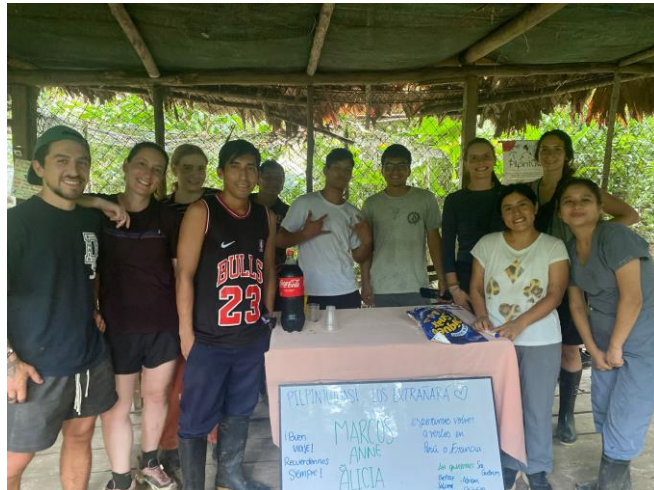
Nasenbären mit ihren enrichments (links) und Team Pilpintuwasi mit Freiwilligen auf ihrer Abschiedsfeier (rechts)