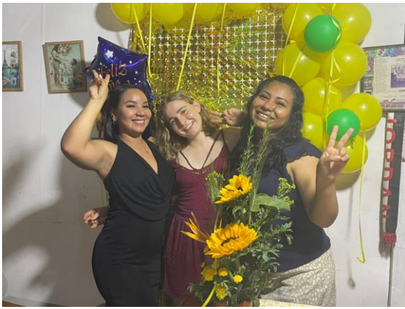
Silvesterfeier mit u.a. meiner Gastschwester Weihnachtsessen mit der Verwandtschaft (rechts) und ihrer Cousine (links)