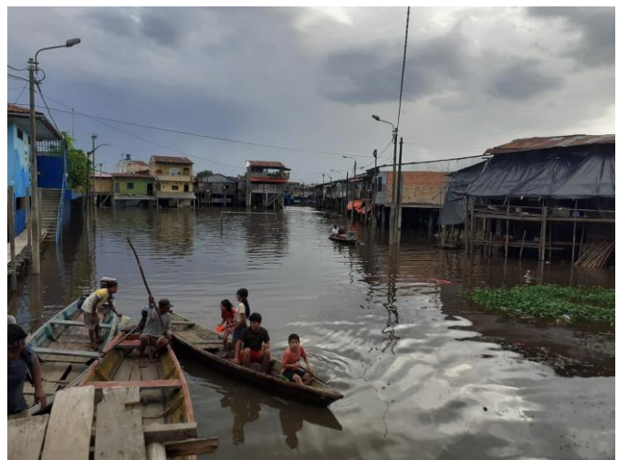
Weg mit dem Boot zum Casa Joabe

als in Deutschland – ein halber Weltuntergang ist es hier ;)