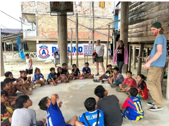
Auf dem Basketballplatz mit den Kindern

einzubringen, und auch die Kinder waren motiviert dabei. Im Casa Joabe haben wir auch zusammen Weihnachten gefeiert – die Kinder haben Tänze aufgeführt, es gab Spiele, eine Piñata und Geschenke. Und wie in der ganzen Weihnachtszeit gab es viel Panetón (süßes Gebäck) und Kakao. Es war sehr schön, die Kinder so glücklich zu sehen. Nach Weihnachten hatten die Kinder Ferien, da habe ich nur noch auf der Straße mit ihnen gespielt: Rollenspielen, Fangen mit und ohne Ball, Seilspringen, Malen, Schreiben und mehr.