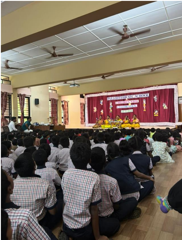
Children's Day an der Pallotti Schule

stattgefunden hat. Wie der Name schon sagt, stehen an diesem Tag die Kinder im Mittelpunkt und die Lehrerinnen bereiten verschiedene Programmpunkte für sie vor. Wir drei haben zum Beispiel in der Woche vorher einen Tanz einstudiert, den wir dann am Freitag aufgeführt haben. Auch die Lehrerinnen haben getanzt, gesungen und kleine Theaterstücke vorbereitet.