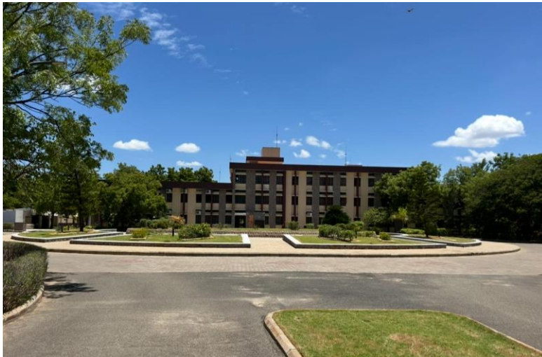
Hauptgebäude des Pillar Campus

Das PILLAR Centre, kurz für Pallotti Institute of Lay Leadership Animation and Research, dient als Bildungs- und Begegnungsstätte, in der regelmäßig Gruppen und Organisationen Seminare und Workshops abhalten. Die Fathers stellen die Räumlichkeiten zur Verfügung und sorgen für den reibungslosen Ablauf auf dem Campus.