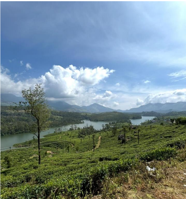
Trip nach Munnar

Wir waren außerdem an einem Tempel und konnten etwas durch Thrissur schlendern. Am nächsten Tag waren wir noch in einem Elefantenpark, den ich nicht so gut fand, da die Elefanten angekettet waren und sich kaum bewegen konnten. Anschließend haben wir uns auf den Rückweg begeben mit einem kurzen zwischen Stop zum shoppen.