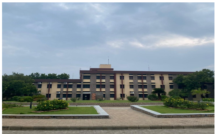
Frontansicht des Hauptgebäudes des Pillar Campus

Dieser liegt am Rand der Millionenstadt Madurai im Bundesstaat Tamil Nadu in Südindien. Etwa 1 km von der Schnellstraße entfernt, liegt Pillar in der Ortschaft Nagamalai Pudukottai, welche übersetzt Schlangenberg bedeutet und nach der Form eines naheliegenden Bergrückens benannt ist.