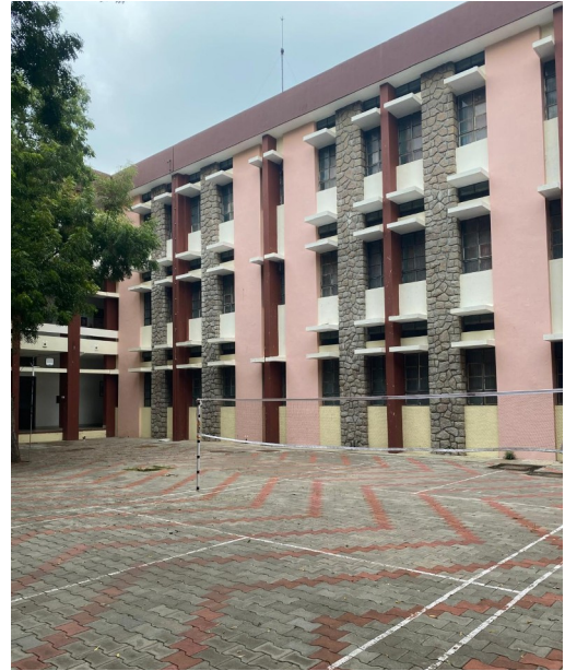
Badmintonfeld im Innenhof des Hauses

Abends haben wir dann schließlich etwas Zeit für uns. Diese nutze ich gerne zum Telefonieren, Lesen, Häkeln oder einfach nur Entspannen und Nachdenken. Zudem habe ich meine Querflöte aus Deutschland mitgenommen, für die ich hier wieder etwas mehr Zeit finden kann.