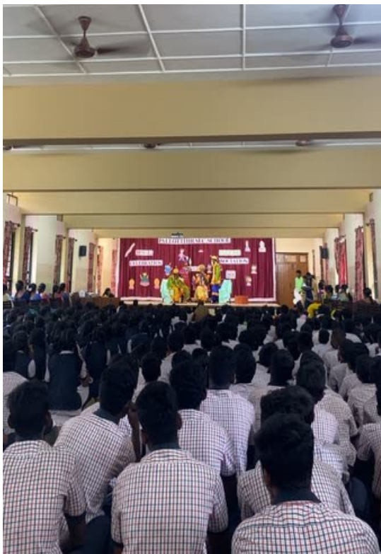
Schauspiel der Schüler*innen anlässlich des hinduistischen Lichterfests Diwali

Ähnliche Probleme habe ich in der Bruder Klaus School, in der wir nach dem Mittagessen jeweils eine Unterrichtsstunde wechselnd in der ersten bis siebten Klasse verbringen, allerdings ohne begleitende Lehrer*innen. Diese Stunde soll in erster Linie den Zweck erfüllen, die Kinder zum Englischsprechen zu ermutigen, allerdings sind uns bezüglich der Unterrichtsgestaltung keine richtigen Vorgaben gesetzt. Dies macht es für mich ziemlich herausfordernd, Ideen für den Unterricht zu finden, die gerade die Kinder der jüngeren Klassen verstehen, aber sie auch beschäftigt hält. Ohne Lehrpersonal im Raum ist es ziemlich schwierig für mich, die Schüler*innen unter Kontrolle zu halten. Daher ist dies für mich momentan auf jeden Fall der herausforderndste Part meines Tages.