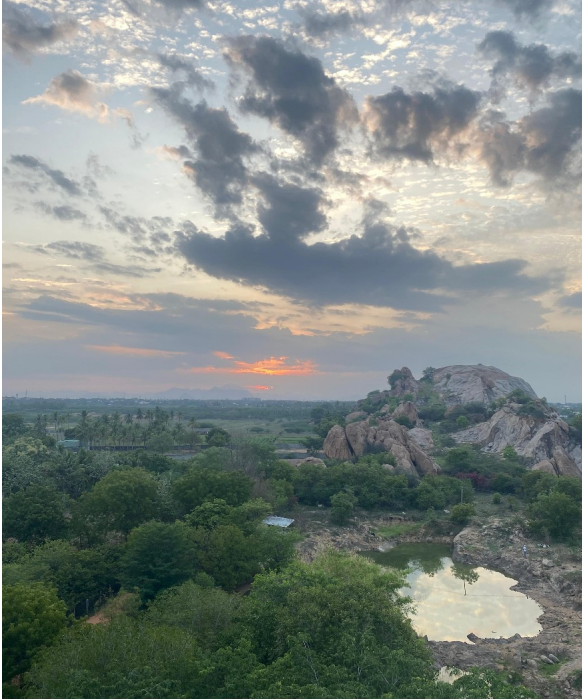
Blick vom Prayerrock auf den See sowie die Felsen außerhalb des Geländes

Das Haus der Pallotiner umfasst nicht nur die Unterbringung der Community sowie mancher Angestellter, sondern auch ein großes Seminarhaus mit über 100 Zimmern. Dabei handelt es sich oft um Gruppen von Priestern, die hier ein „Retreat“ durchführen, Fortbildungen für Lehrer*innen oder sonstige Seminargruppen. Dadurch ist hier im Haus und auf dem Campus immer viel los.