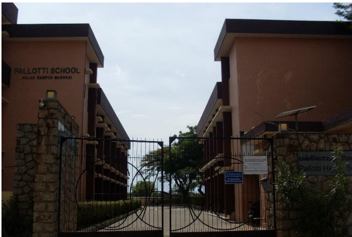
Abbildung 5: Haupteingang Pallotti Higher Secondary School

Menschen zusätzlich erschwert. Besonders für diejenigen, die den Kallar (Dieb), Valayar (Jägern) oder Dalits angehörten hatten (bzw. haben) durch ihren Ruf aus der Kolonialherrschaft mit anhaltender Verachtung und Ausgrenzung zu kämpfen.