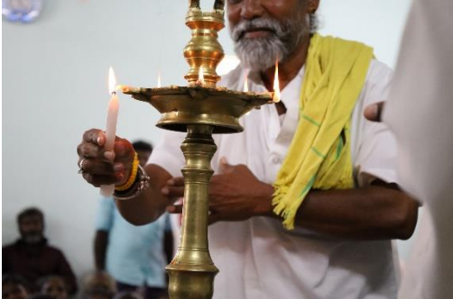
Abbildung 3: Einweihung bzw. Segnung der Halle für die Kinder der Nomad*innen