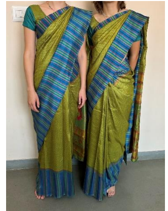
Abbildung 2: Schuluniform für Lehrerinnen, wird jeden Montag getragen