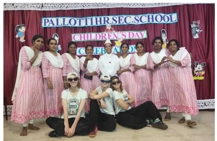
Abbildung 4: Wir mit ein paar der Lehrerinnen am Children's Day

Um 10:35 Uhr sitzen wir dann im Lehrerzimmer der Pallotti-Schule, trinken einen Tee und quatschen mit den Lehrerinnen oder untereinander, bevor es dann in den Unterricht geht. Jede Stunde verbringen wir in unterschiedlichen Klassen, weswegen jede Erfahrung in den jeweiligen Fächern variiert. Wenn ich beispielsweise mit der fünften Klasse games-lesson habe, spiele ich mit den Kindern Dodgeball , Volleyball , versuche ihnen Fußball oder Jonglieren beizubringen oder mich ein bisschen mit ihnen zu unterhalten.